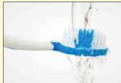
最近的一项研究发现，怀孕期间摄入氟化物可能会影响孩子的智商。

这项研究于2019年8月19日在线发表在《美国医学会儿科杂志》上，标题为“加拿大孕期母亲摄入氟化物与其后代IQ得分之间的关系”。 DT