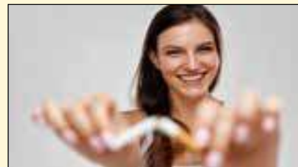
一项新的研究显示，英国每年的香烟销量和吸烟量减少了10亿多。

“吸烟仍然是导致癌症的最主要的可预防的原因，某些群体的吸烟率要高得多，例如日常工作人员和体力劳动者，所以我们不能