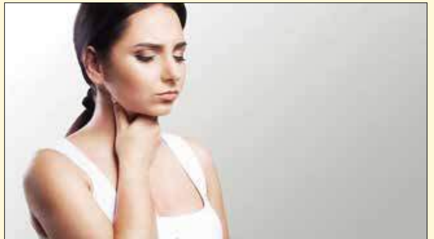
研究人员最近完成了一项为期七年的研究，研究了接受机器人手术或放射治疗的喉癌患者术后的吞咽情况。

这项研究于2019年5月26日在线发表在《临床肿瘤学杂志》上，标题为“早期口咽鳞状细胞癌的二期随机试验：放射治疗与经口机器人手术（ORATOR）的比较”。DT