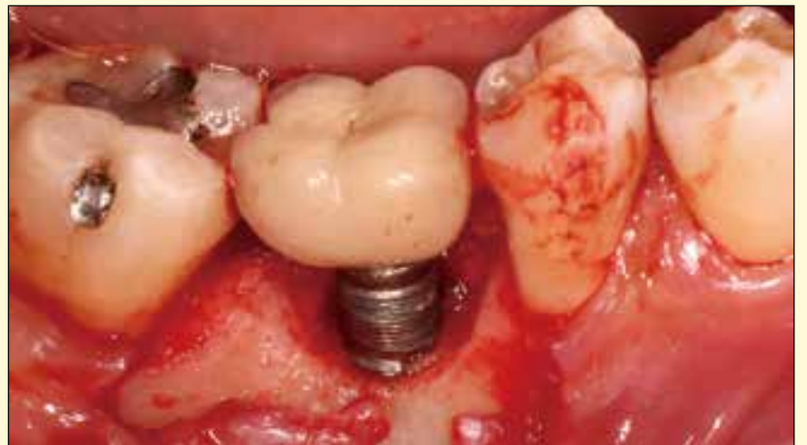
一项近期研究表明，种植体周围炎是导致种植失败的主要原因。

瑞士，苏黎世：种植牙已经成为一种理想的替代缺失牙的治疗方法，不同方法的成功率都很高。然而，同所有治疗一样，种植牙也有可能发生生物学并发症，并导致种植失败。情况糟糕时，还需拔除种植体。苏黎世大学研究人员最近的一项研究重新分析了