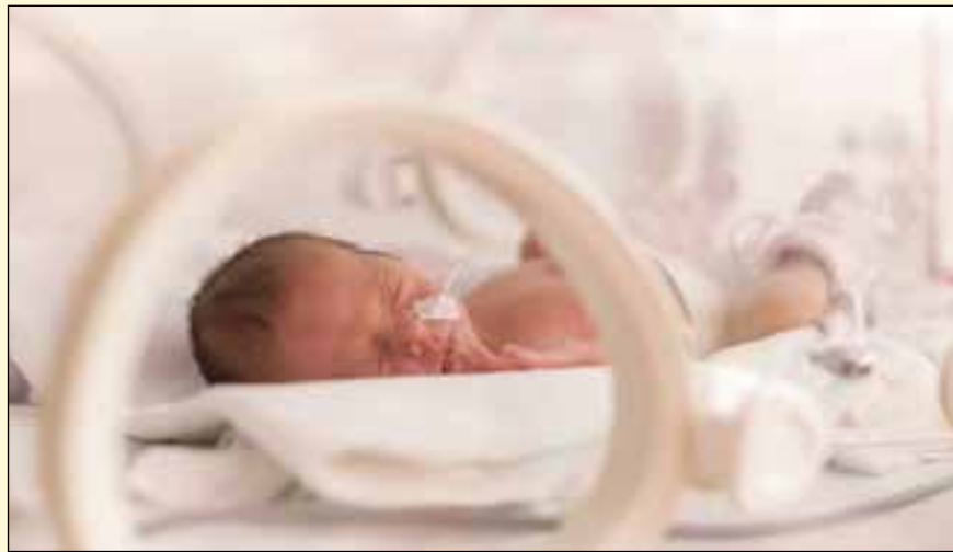
最近一项研究表明, 患牙周病的孕妇更有可能出现早产。

高, 口腔健康基金会的首席执行官Nigel Carter博士 (OBE) 强调了口腔健康对全身健康的重要性, “我们的口腔健康会直接影响到我们的全身健康, 其中包括正常健康