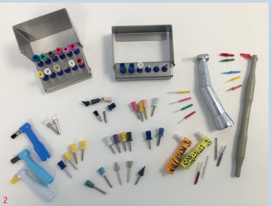
Abb. 1: Prophylaxepasten im Überblick. Für Allergiker geeignet: Lunos® neutral, Dürr Dental; Cleanic® light, Kerr Hawe. Vegane Pasten: ProfiGuard, Becht. – Abb. 2: Politurmedien im Überblick. Prophylaxebürstchen, Kelche und Medien zur Interdentalraumpolitur (CPS roto, Curaden; PDH Profin manuelles Handstück, Loser).

welche sich bei der Anwendung in ihrer Körnung minimieren, also selbstreduzierend sind. Bei diesen Pasten wird kein zweiter oder dritter Politurgang nötig, was sich während der Prophylaxesitzung positiv auf das Zeitmanagement auswirken kann.