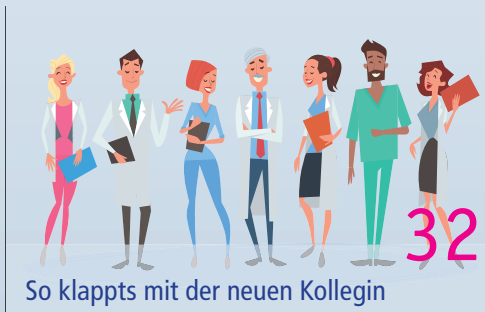
So klappts mit der neuen Kollegin