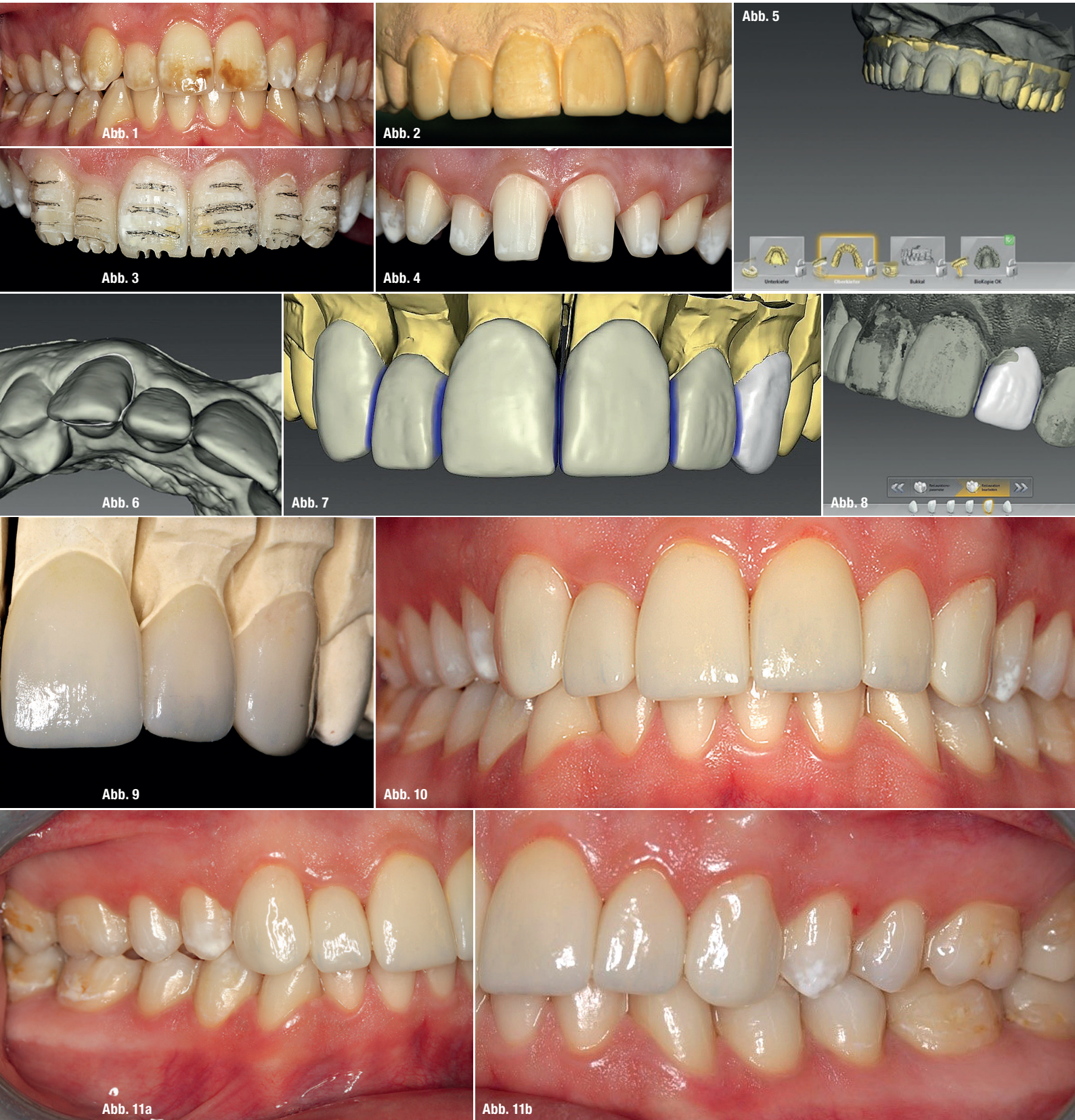
Abb. 1: Ausgangssituation. Abb. 2: Wax-up auf dem Situationsmodell. Abb. 3: Horizontale und vertikale Orientierungsgrillen für die Präparation durch das Mock-up. Abb. 4: Die fertige Präparation. Abb. 5: Sägeschnittmodell und Wax-up sind virtuell überlagert für das vereinfachte Design mit Biogenetikkopie. Abb. 6: Einzeichnen der Kopielinie im Wax-up. Abb. 7: Fertig designte Restaurationen im CEREC InLab 18.0 (Dentsply Sirona). Abb. 8: Wax-up mit fertigen Restauration überlagert. Abb. 9: Fertige Veneers auf dem Gipsmodell angepasst. Abb. 10–11b: Situation sechs Monate nach der ästhetischen Rehabilitation.