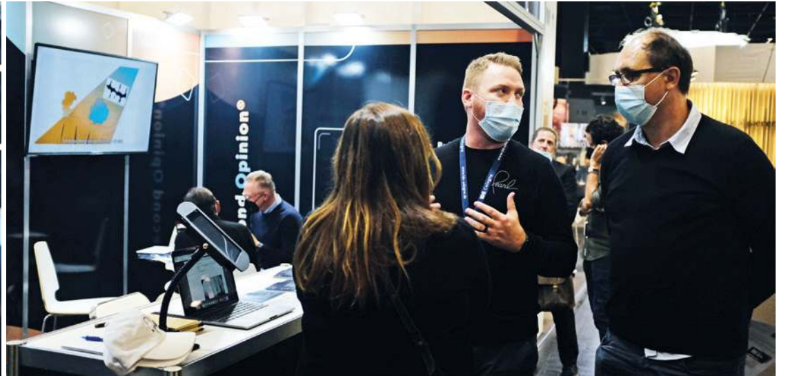
• Pearl stellt auf der IDS 2021 die zahnmedizinische KI-Lösung Second Opinion vor. • Pearl launches Second Opinion dental AI solution at IDS 2021.

■ Pearl, ein führender Anbieter von Systemen mit künstlicher Intelligenz (KI) für Zahnarztpraxen, hat heute auf der IDS 2021 die Markteinführung