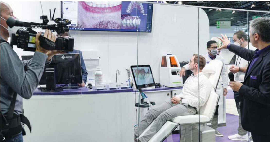
1: Imagine the CADabilities 2: ChairsideCAD workflow. 3: Livestream at IDS.