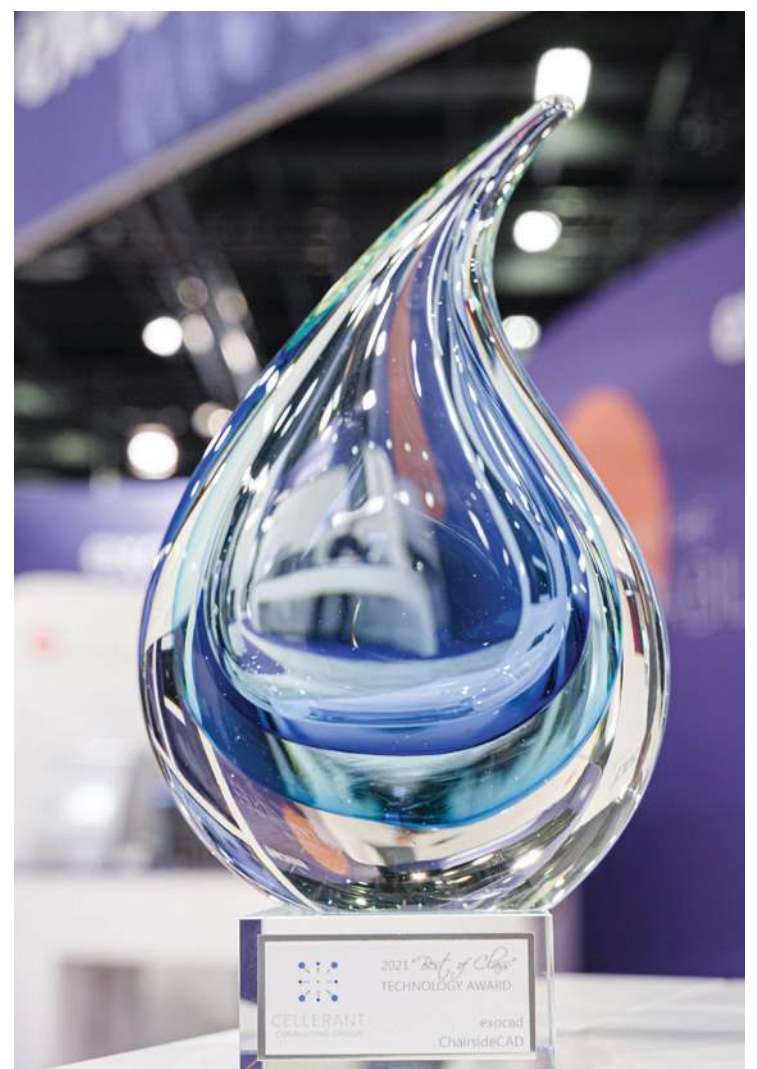
• ChairsideCAD BOC award 2021.

More information can be found at www.exocad.com/ids . ◀