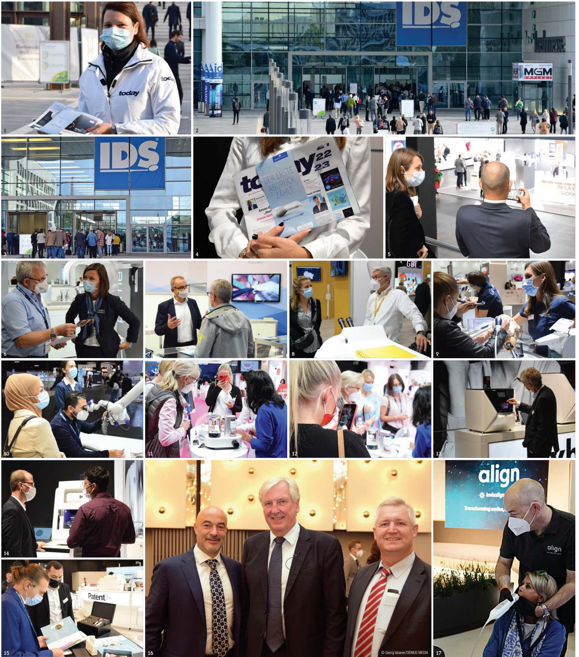
1: Exemplare der IDS-Zeitung today werden an allen Eingängen verteilt. 2: Das Gelände der Koelnmesse dient seit vielen Jahren als Kongress- und Messezentrum der IDS. Das ist 2021 natürlich genauso. 3: Besucher stehen Schlange, um zur IDS 2021 eingelassen zu werden. 4: Frisch aus dem Drucker: Die aktuelle Ausgabe der IDS-Tageszeitung today . 5: Tausende von Besuchern reisten nach Köln, um die neuesten Innovationen der Dentalbranche zu erleben. 6: ACTEON Stand auf der IDS 2021. 7: BEGO Stand auf der IDS 2021. 8: HORICO Stand auf der IDS 2021. 9: Produktvorführung am Stand von Dürr Dental. 10: Produktvorführung am Stand von Zeiss. 11 und 12: Produktvorführung am EMS Stand. 13 und 14: Produktvorführung am vhf camufacture Stand. 15: Ausstellungsstand von Patent auf der IDS 2021. 16: Dental Tribune International CEO Torsten Oemus (links), Dr. Robert Gottlander, Präsident und CEO von Neoss (Mitte), und Rainer Woyna, Marketing Manager von Neoss, bei der Pressekonferenz des Unternehmens. 17: Bei einer Presseveranstaltung am Eröffnungstag der IDS 2021 wurde der iTero Element 5D-Scanner zusammen mit der neuen Software iTero Workflow 2.0 live vorgeführt.