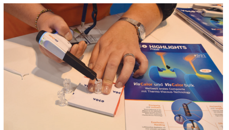
•Produkt demonstration des VisCalor-Komposits. •Product demonstration of the VisCalor composite.

At IDS, we are concentrating on our new VisCalor product. It is the first composite in the world to feature thermally controlled viscosity behaviour. At the last IDS, we presented VisCalor Bulk, so we are now expanding our product range. It is available in various VITA shades, allowing the