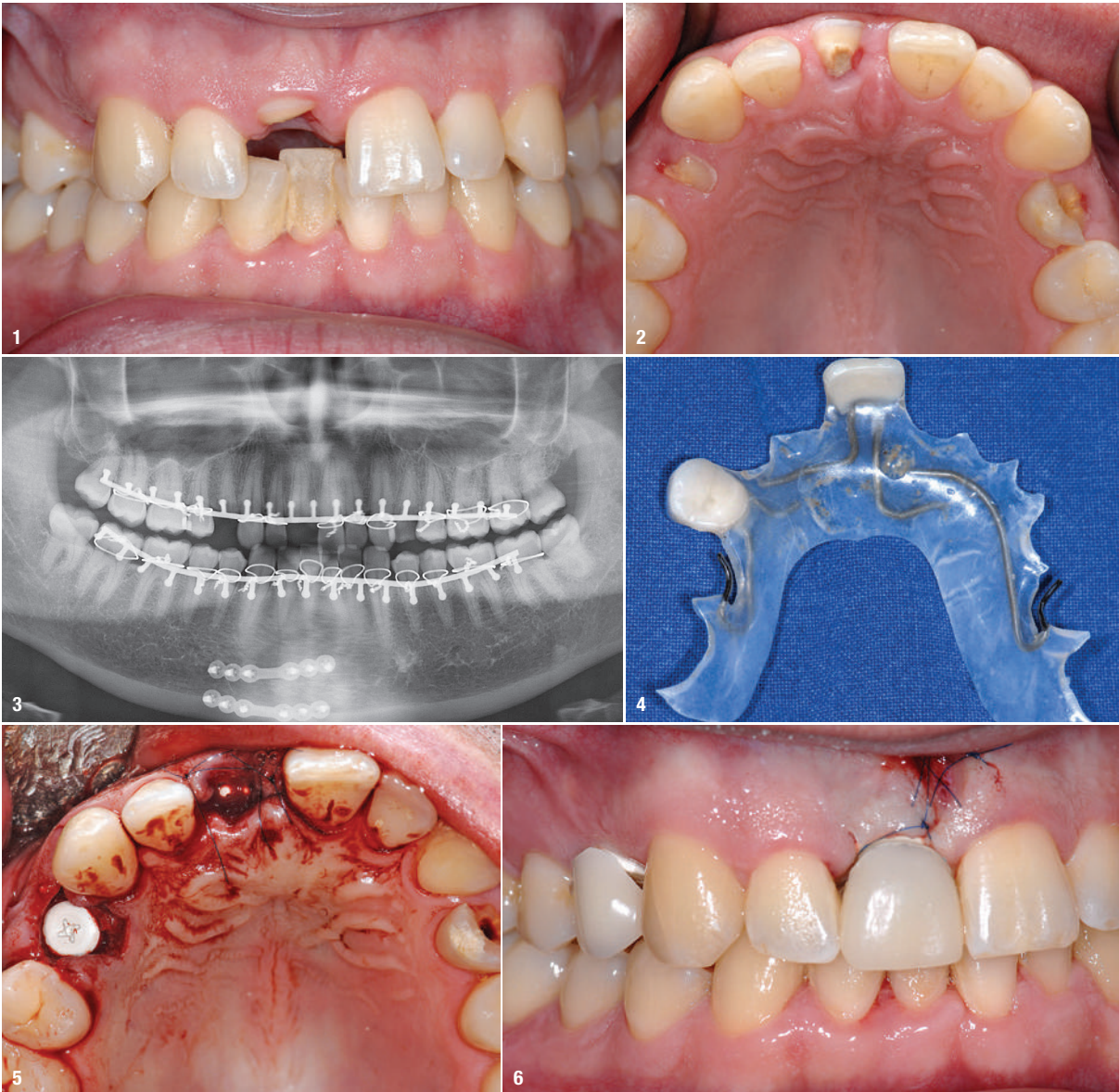
Abb. 1–3: Klinische Ausgangssituation. Teilfrakturen der Zähne 11, 14 und 24 nach Trauma. Abb. 4: Kunststoffklammerprovisorium mit innen liegenden Klammern diente als temporärer Ersatz. Abb. 5 und 6: Beide Keramikimplantate konnten primärstabil inseriert werden.

Sichere industrielle Verarbeitungstechnologien sind daher bei der Herstellung sowie der Oberflächenbearbeitung dieses besonderen Materials von großer Bedeutung, um die gewünschte Bruchfestigkeit von ZrO_2 -Implantaten zu gewährleisten. Histomorphometrische Untersuchungen und Torque-out-Tests haben gezeigt, dass die Osseointegration von an der Oberfläche ausreichend mikrorau veränderten ZrO_2 -Implantaten als gesichert angesehen werden kann und auf dem Niveau von Titanimplantaten zu werten ist. 5–8 Anwender sollten daher bei der zukünftigen Auswahl von entsprechenden Medizinprodukten Hintergrundinformationen von präklinischen Versuchen zum Osseointegrationsverhalten der ZrO_2 -Implantate und deren Herstellungsprozess nachfragen.