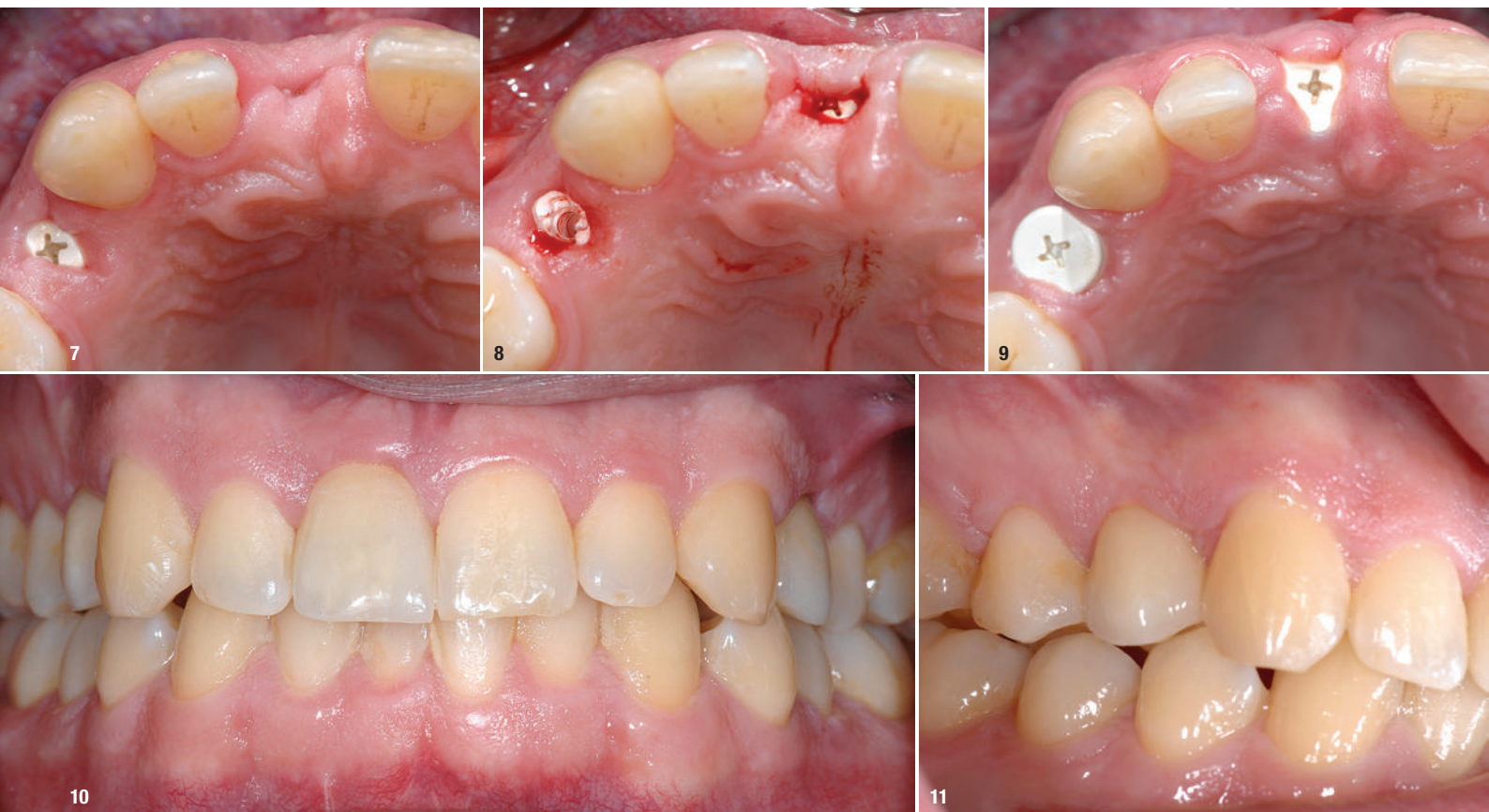
Abb. 7: Das Implantatinnengewinde wurde mit einer kleinen PEEK-Schraube verschlossen. Abb. 8–11: Drei Monate später konnte die Patientin mit verschraubbaren Vollkeramikronen versorgt werden.