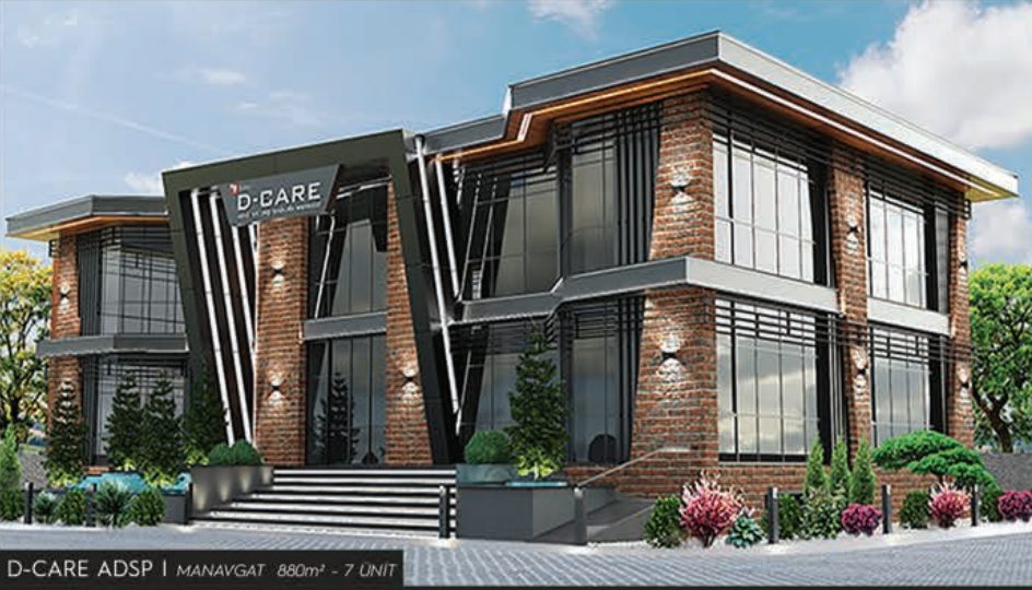
D-CARE ADSP | MANAVGAT 880m 2 - 7 UNIT