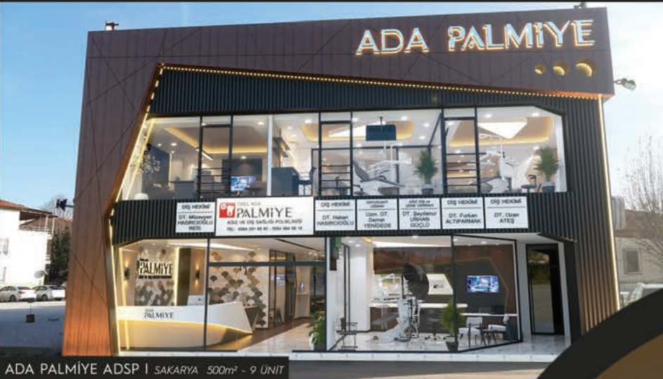
ADA PALMIYE ADSP | SAKARYA 500m 2 - 9 UNIT