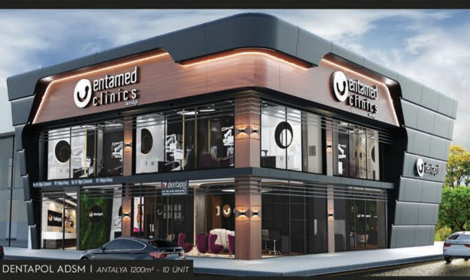
DENTAPOL ADSP | ANTALYA 1200m 2 - 10 UNIT