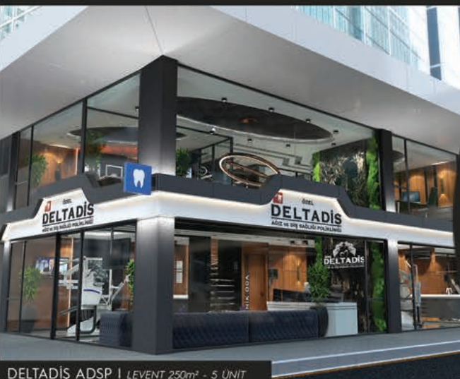
DELTAĐIŐ ADSP | LEVENT 250m 2 - 5 UNIT