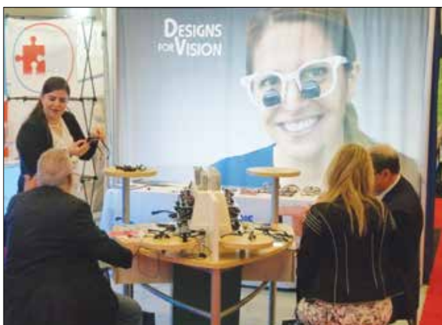
· Rendez-vous au kiosque no 210 de Designs for Vision, afin de profiter des prix spéciaux sur les loupes binoculaires et les lampes. · Find show specials on loupes and headlights in the Designs for Vision booth, No. 210.