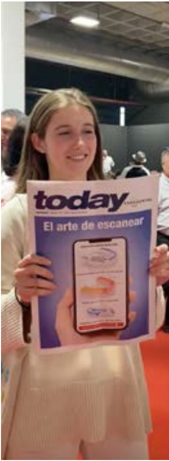
Una asistente al congreso con un ejemplar de "Today Expodental", el periódico de ferias de Dental Tribune que se distribuyó en la feria.