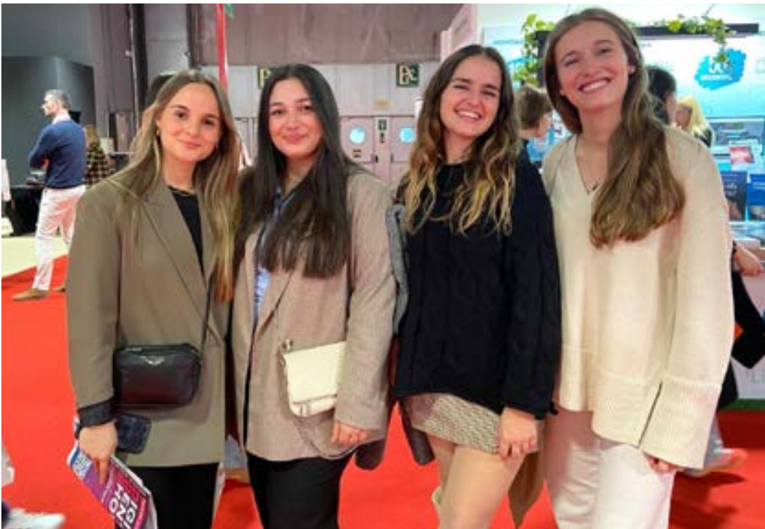
Un grupo de estudiantes de odontología de la Universidad de Barcelona.