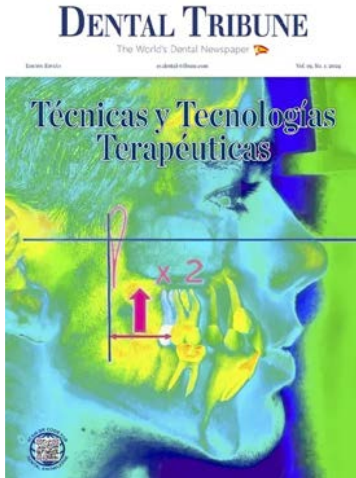
Una de las ediciones de la publicación Dental Tribune España, la cual estuvo dedicada a técnicas y tecnologías terapéuticas.