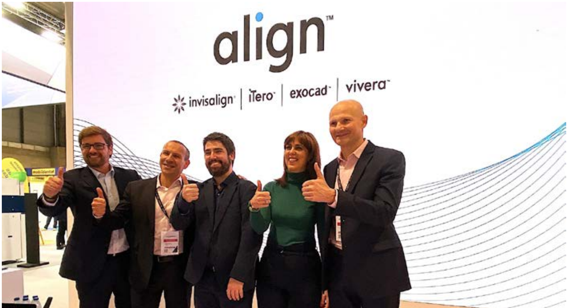
El equipo de Align Technology que presentó las nuevas tecnologías en EXPODENTAL Madrid 2024.