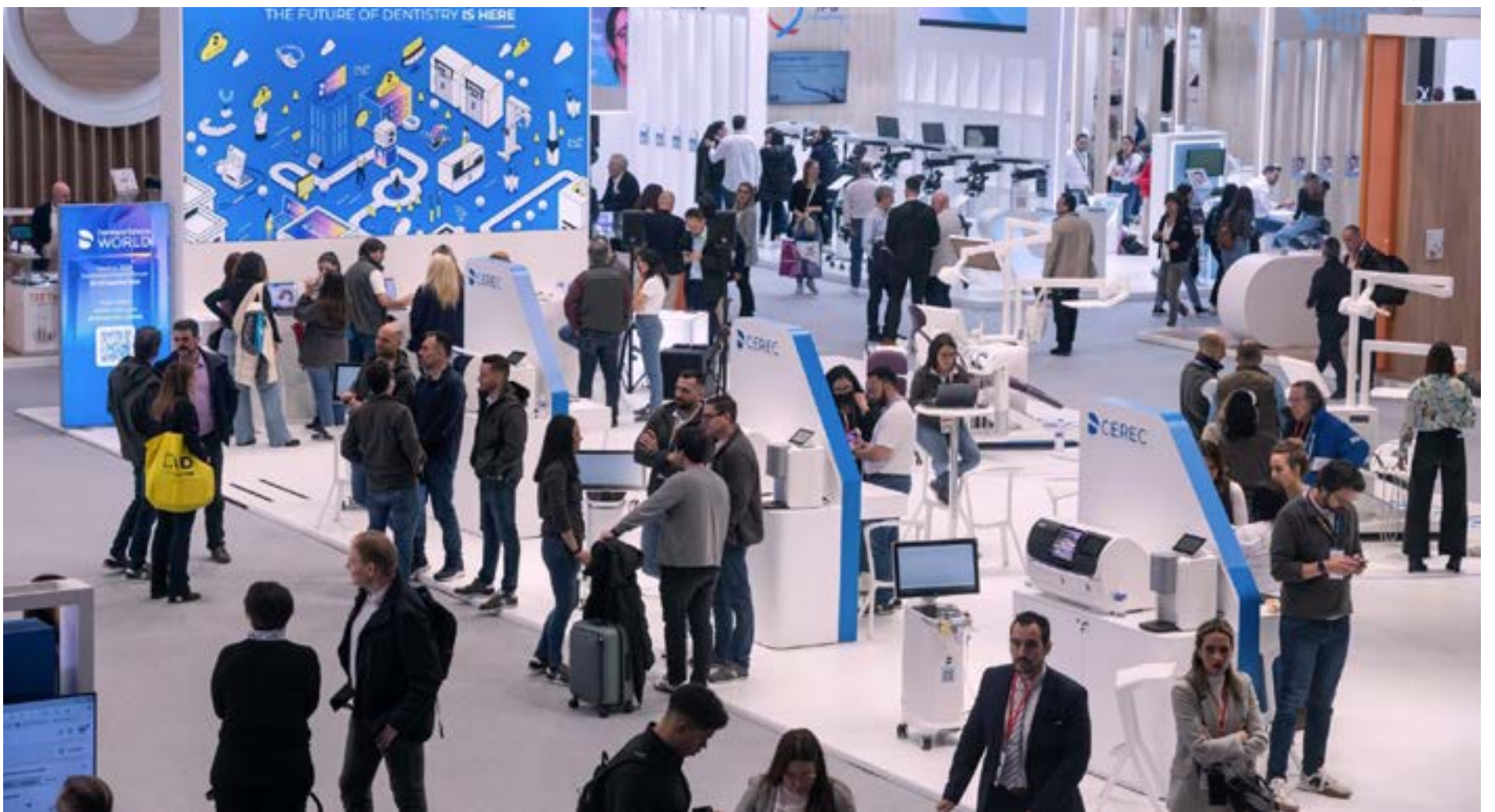
La feria ofreció secciones interactivas donde probar nuevos productos y dispositivos.