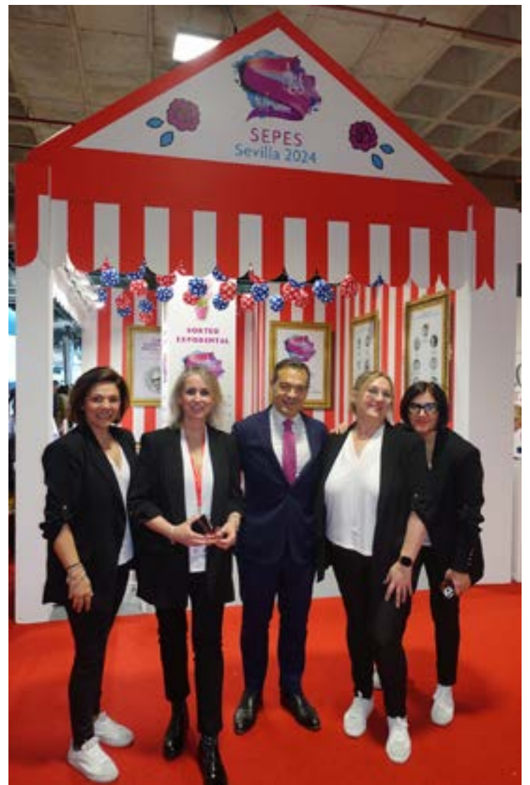
El stand de la Sociedad Española de Prótesis Estomatológica, cuyo próximo congreso se celebrará en Sevilla.