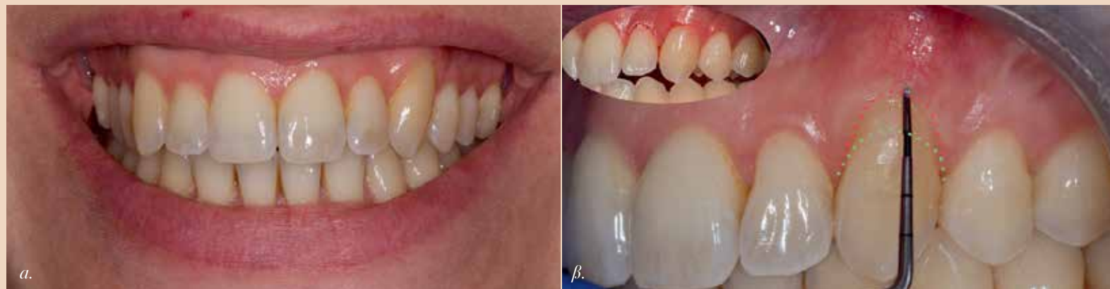
Εικ.5: Η γραμμή γέλιτος σε 1 χρόνο α) γενικό χαμόγελο β) οδοντική αποκάλυψη με υφίζηση

οποία είναι ικανοποιημένη με το τελικό αποτέλεσμα (Εικ.5) Από την πλευρά του πολφού, δεδομένου του θετικού προεγχειρητικού ελέγχου ευαισθησίας, θεωρήθηκε απαραίτητο σε αυτήν την περίπτωση να προσπαθήσουμε να διατηρήσουμε τη ζωτικότητα του δοντιού. Σύμφωνα με τον κλινικό έλεγχο και το ιστορικό πόνου, η εμπλοκή του πολφού φαίνεται να