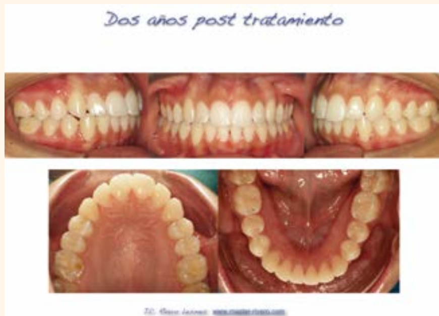
Figura 8. Caso 2.

poder contrastar resultados a corto y, mucho menos, a largo plazo.