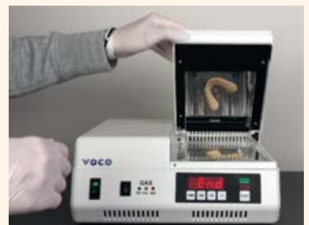
Figura 13. Unidad de fotopolimerización por luz ultravioleta.