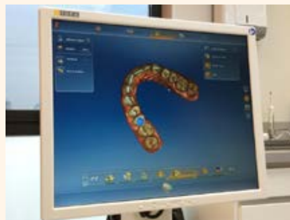
Figura 9. Escaner intraoral CEREC.