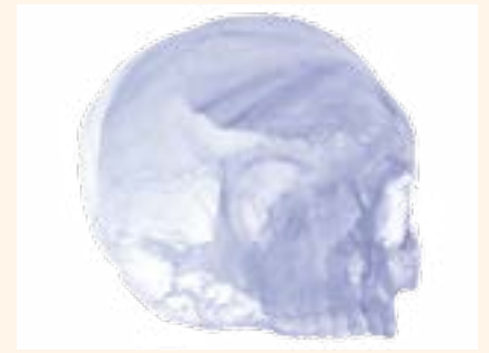
Figura 7. Cráneo maya impreso en 3D.

la cabeza de sus hijos para controlar el crecimiento craneofacial (Fig. 2). Los mayas utilizaron la existencia de las fontanelas, áreas de tejido entre los huesos del cráneo, para dar forma a la cabeza de los niños. El resultado era un cráneo aplanado en la frente y el hueso occipital con una forma ovoide general. Esta deformación no se realizaba con fines terapéuticos, sino con fines plásticos. Era cultural y permitía identificar el grupo étnico y social del individuo.