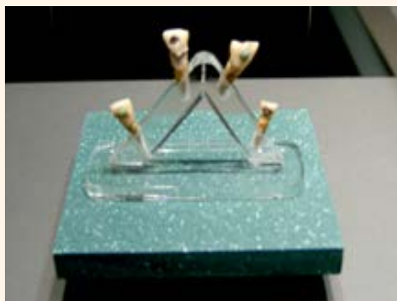
Figura 8. Dientes mayas.

mos reproducir tres artefactos de la sonrisa maya. Los pasos anteriores -adquisición, diseño e impresión 3D- permitieron la creación digital de un wax-up y dos mock-ups. El primer paso requirió el uso de un escáner intraoral (Omnicam CEREC, Dentsply Sirona; Fig. 9). La arcada maxilar de un paciente se escaneó con gran detalle para obtener el artefacto lo más realista posible. La impresión digital se exportó como un archivo STL para poder editarla fácilmente con el software. En el segundo paso, se utilizó un software de modelado para crear una base para la impresión 3D de un modelo dental (Fig. 10). Se imprimió directamente en 3D (SolFlex170, V-Printmodel; Fig. 11) para obtener la arcada dentaria del paciente (Fig. 12). Para optimizar la fotopolimerización, el modelo se expuso a destellos UV (OtoFlash, VOCO; Fig. 13). Se ha realizado un wax-up inspirado en las sonrisas mayas. La forma de los dientes frontales se ha modificado para cumplir con los criterios estéticos de los mayas. Se desgastó el borde incisal y se realizó un escalón en los incisivos centrales. Los dientes se cubrieron con una resina (fluida) (Admira Fusion Flow, VOCO) A3.5 para los molares,