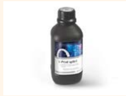
Figura 6. V-Print splint.