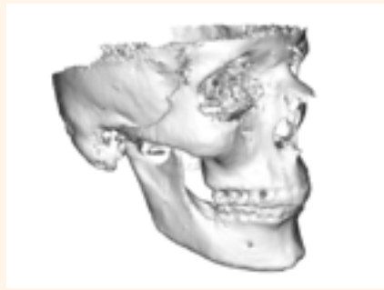
Figura 4. Reconstrucción del cráneo.