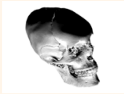
Figura 5. Cráneo Maya Virtual.