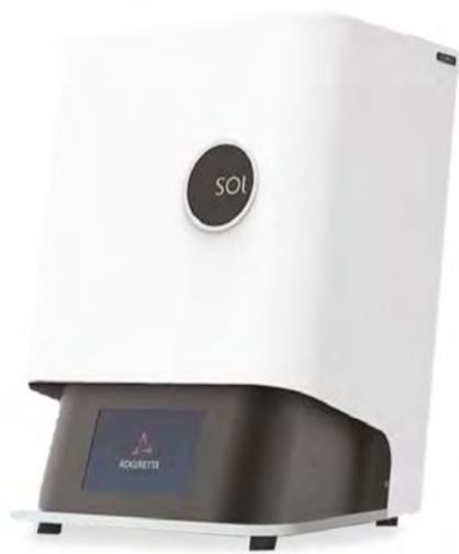
SOL LCD 3D Printer