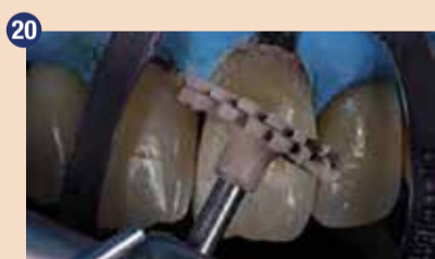
20 Pomembno je, da restavracije finiřiramo in spoliřiramo – posebej tiste zraven dlesni – da dosežemo gladko površino, ključno za ohranjanje zdravih parodontalnih tkiv.