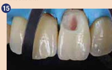
Pomembno je odstraniti sklenino brez opore, saj se s tem izognemo razpokam med polimerizacijo.