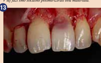
Po dvigu gingivalnega režnja sta se pokazala kaviteta in mehko tkivo, zaradi česar smo lažje očistili področje in namestili izolacijo z gumijasto opno.