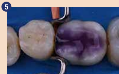
V tem primeru smo izbrali tehniko total-etch (totalno jedkanje). Pred nanosom 1-PRIMERJA na sklenino in dentin smo nanесли gel iz 35 % fosforne kisline.