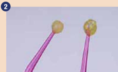
G2-BOND Universal: 1-PRIMER in 2-BOND. Njuna rumenkasta barva pomeni prisotnost fotoiniciatorja v obeh komponentah. Barva po polimerizacijski reakciji izgine.