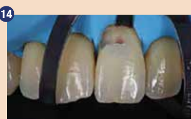
Izolacija iz gumijaste opne štiti operativno področje pred vlago in okužbo.