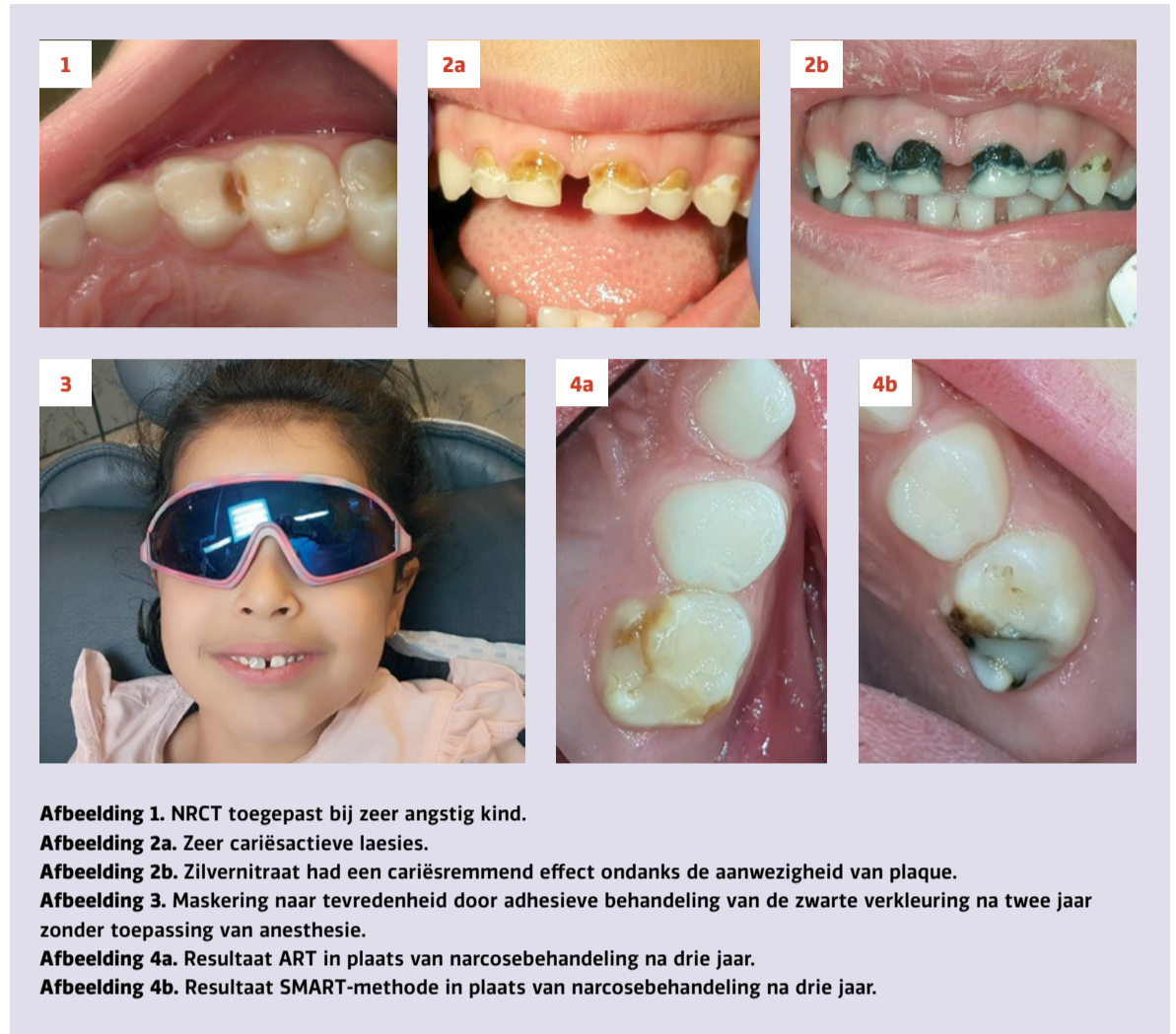
Afbeelding 1. NRCT toegepast bij zeer angstig kind.

Bij onderstaande casussen koos ik voor prioritering van causale the-