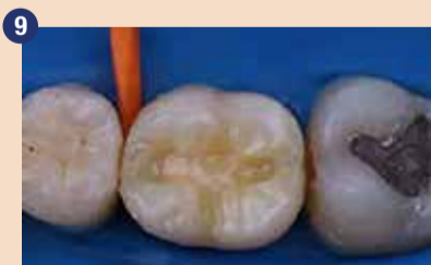
Nanесли smo sloj G-ænial A'CHORD odtenka A4, ki je nadomestil manjkajoči dentinski del.