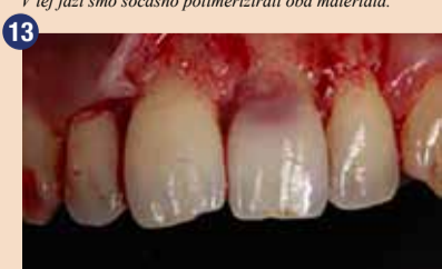
Po dvigu gingivalnega režnja sta se pokazala kaviteta in mehko tkivo, zaradi česar smo lažje očistili področje in namestili izolacijo z gumijasto opno.