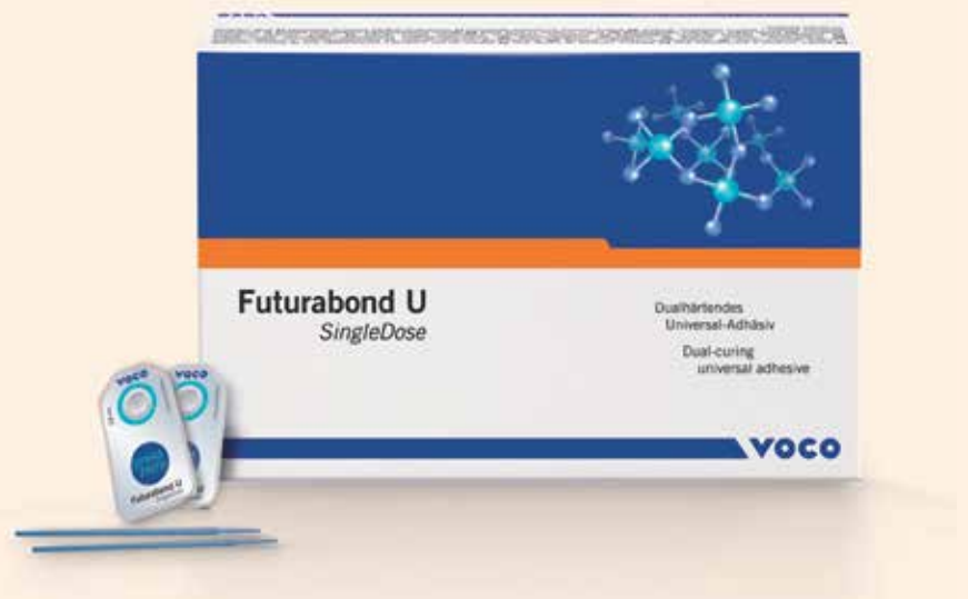
El nuevo Futurabond U de fotocurado dual de dosis única de VOCO.