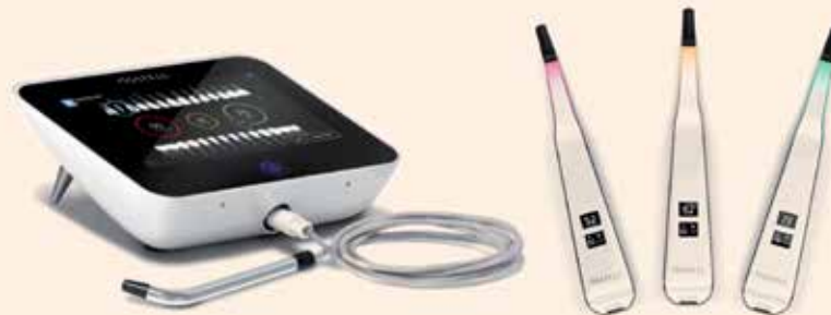
El módulo Osstell ISQ inalámbrico guarda automáticamente la información de la oseointegración en la nube.

técnica no invasiva que no produce ninguna sensación a los pacientes durante los 1 a 2 segundos que dura. La técnica se conoce como frecuencia de resonancia del coeficiente de estabilidad primaria y que permite saber las posibilidades reales de éxito de una