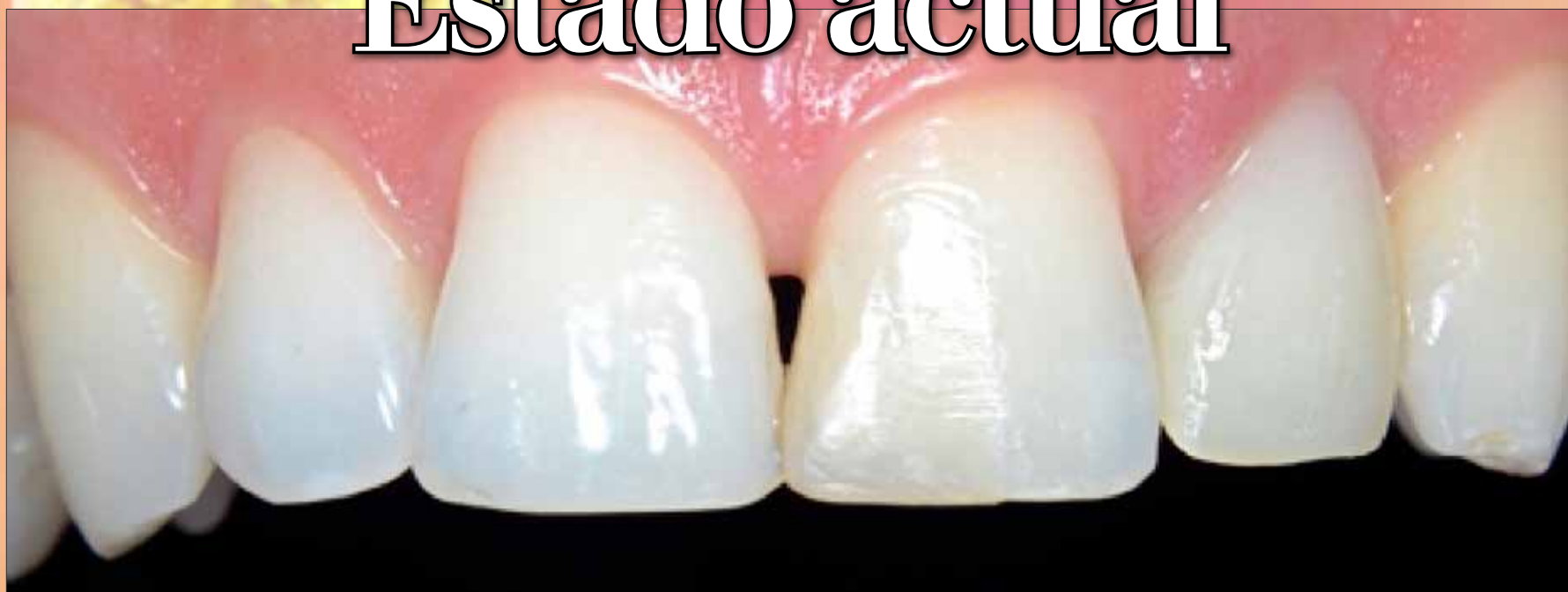
Caso inicial. Restauración en el sector anterior con modificación cromática.