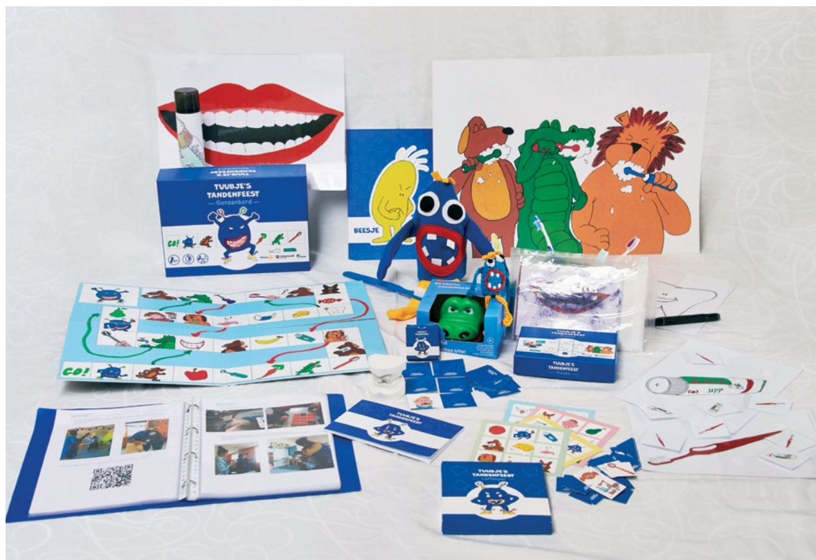
De inhoud van de Mondgezondheidskoffer.

Ik kan niet genoeg benadrukken dat ik heel dankbaar ben voor de financiële steun van de Rotary en de leerkrachten van het buitengewoon onderwijs die deze zeer kwetsbare kinderen moeten leren poetsen. Dat is onbetaalbaar. Dit project vindt maatschappelijk heel veel weerklank. Gelukkig maar, omdat kinderen in het buitengewoon onderwijs heel vaak een vergeten groep zijn. Het mooiste vond ik een jongetje van negen dat trots vertelde dat het van zijn gespaarde zakgeld zelf een elektrische tandenborstel had gekocht. Ik word heel gelukkig van dit project, omdat we met een beperkt aantal inspanningen een zeer kwetsbare groep kunnen bereiken voor wie we letterlijk een wereld van verschil kunnen maken. ■