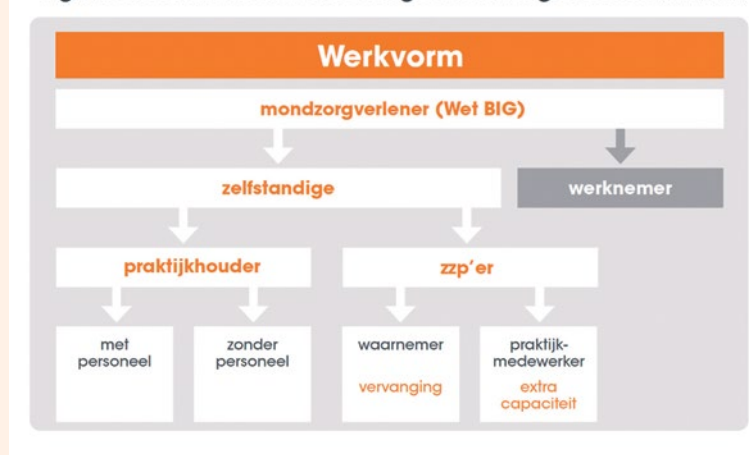
Figuur 3: Werkvormen zelfstandige mondzorgverleners (Bron: VvAA 2020)

In de mondzorg bestaan voor verschillende beroepsgroepen en situaties 'goedgekeurde' modelovereenkomsten. Alle meest recente modelovereenkomsten zijn op dit moment nog bruikbaar en zijn ook daadwerkelijk de norm in de mondzorg. Deze modellen zijn beschikbaar op belastingdienst.nl (zoek op 'modelovereenkomst beroepsgroepen', en kijk dan onder 'Gezondheidszorg'). Figuur 3 toont de werkvormen waarop een mondzorgverlener (tandarts, mondhygiënist of tandprotheticus) momenteel als zelfstandige werkzaam kan zijn.