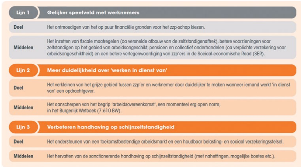
Figuur 1: Zzp-plan kabinet met drie lijnen (dec. 2022)