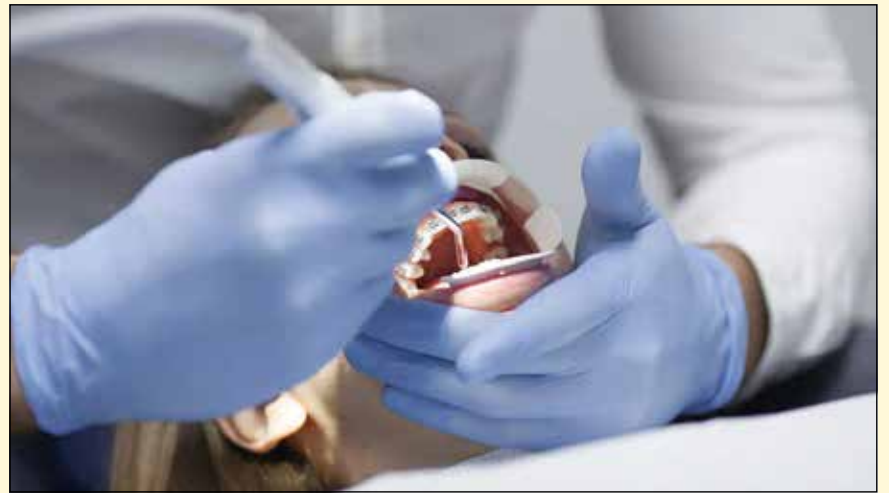
最近的一项研究表明，正畸治疗对龋病发生率没有影响。

根据这些发现，Doğramacı指出：“研究 证据清楚表明，我们只能通过定期刷牙、维 持良好的口腔卫生和定期的牙齿检查，以防 止牙齿出现龋坏。”