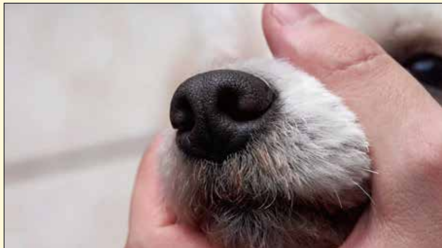
牙科中动物实验大多局限于牙周病学和种植学领域，涉及狗、大鼠和啮齿动物。

这项研究于2019年5月1日在线发表在《牙科杂志》上，标题是“牙周和种植体周的动物实验研究有何变化”。 DT