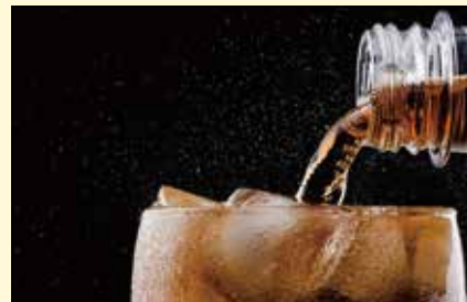
在最近的一项研究中，欧洲的一个研究小组发现软饮料的危害不仅仅是影响口腔健康。

这项题为“10个欧洲国家软饮料摄入与死亡率之间的关系”的研究报告于2019年9月3日在线发表于《美国医学会·内科学卷》上，随后发表在该杂志上。DT