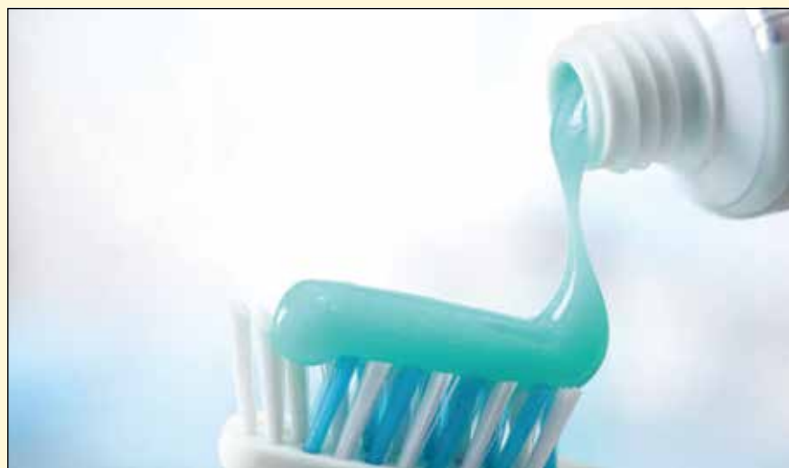
在最近的一项研究中，研究人员发现美国儿童使用的牙膏超出推荐使用量。

尽管如此，疾病预防控制中心和美国儿科学会（AAP）已经开始合作开发针对孕妇和新手母亲的推荐刷牙方法信息。疾病预防控制中心指出，“父母和护理者可以在确保儿童经常刷牙并使用推荐量的牙膏上起到重