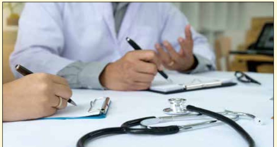
最近一项研究针对向保健中心护士和牙医提供培训是否有助于减少婴儿早期龋病进行了调查。

由于0~3岁儿童龋病发病率较高，研究人员实施了一项针对特定年龄方案，其中包括记录卡和有关秘鲁母婴保健诊所患者口腔健康状况的信息。研究人员对护士进行了口腔健康问题和口腔检查方面的培训，牙医也接受了如何治疗婴儿和微创治疗的培训。