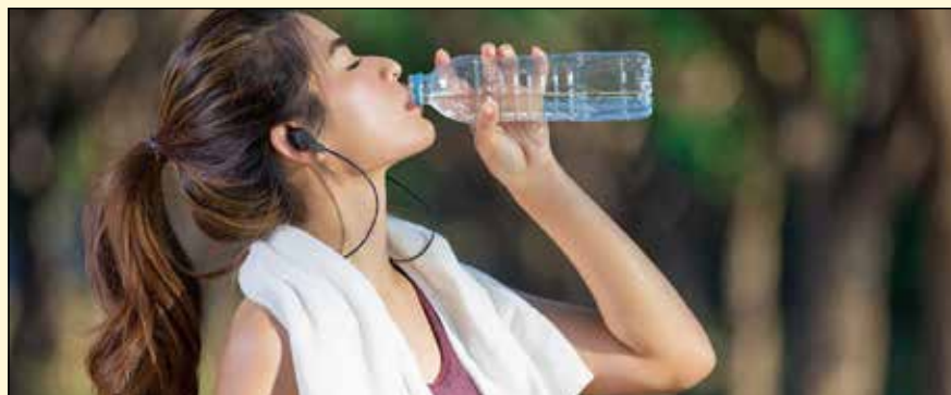
一项新的研究表明，用清水漱口相比，运动后使用漱口水可能会阻碍血压的降低。