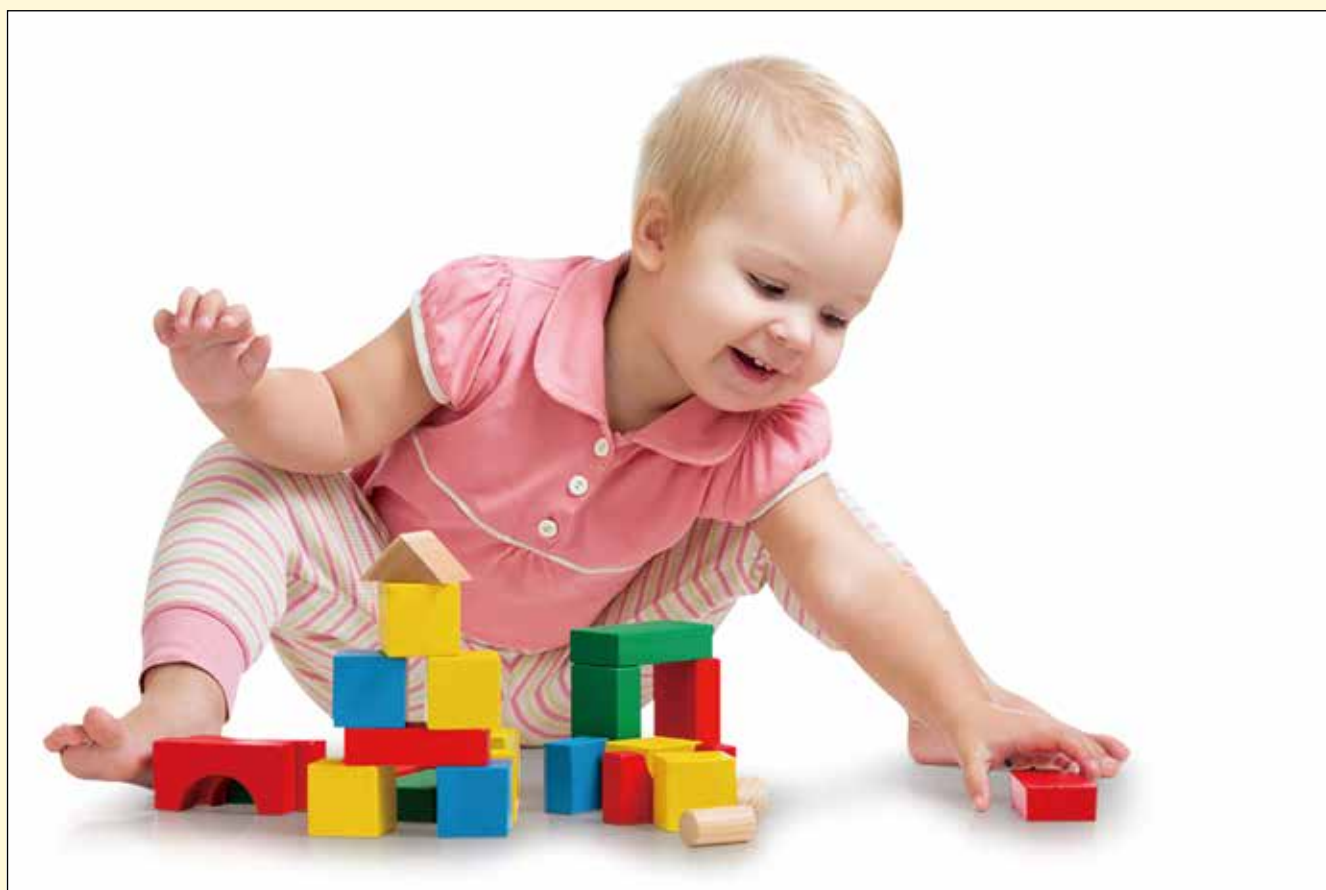
最近的一项研究得出结论，虽然氟保护漆被广泛使用，但在预防学龄前儿童龋齿方面效果甚微。

这项研究并没有完全否定FV的有效性。结果表明，接受过FV治疗的儿童患龋的风险比没有接受FV治疗的儿童下降了12%。虽然这种好处是微不足道的，但在某些情况下，FV仍然可以作为一种成本效益高