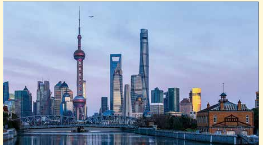
在2019年FDI世界牙科大会上，“世界牙科论坛”学习俱乐部展示了牙科领域一些最新和最伟大的进展。2020年的计划已经在进行中。

此外，线上学习和网络会议的优点在于，不会错过最新的会议，也不会与DT学习俱乐部众多优秀网络研讨会失之交臂。DT