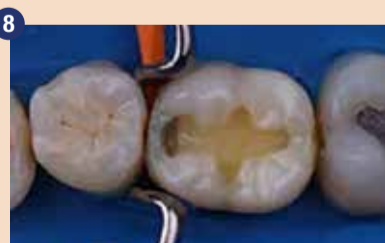
Na cervikalne margine restavracije smo nanесли G-ænial Universal Injectable, temu pa je sledil nanos G-ænial A'CHORD v odtenku JE. Tako smo ustvarili mehurček – prosto aproksimalno površino brez praznin na marginah. V tej fazi smo sočasno polimerizirali oba materiala.