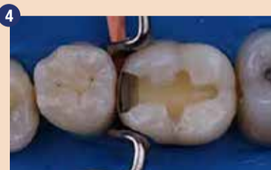
Tipično mezio-okluzalno kaviteto II. razreda smo pripravili.