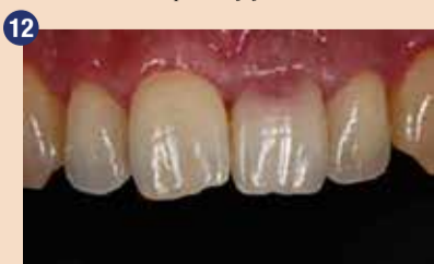
Začetna situacija s suprakrestalno zunanjo resorpcijo na osrednjem sekalcu. Zob je bil še vedno vitalen, zaradi česar smo lahko po dvigu režnja zob direktno restavrirali.