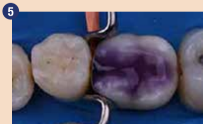
V tem primeru smo izbrali tehniko total-etch (totalno jedkanje). Pred nanosom 1-PRIMERJA na sklenino in dentin smo nanесли gel iz 35 % fosforne kisline.