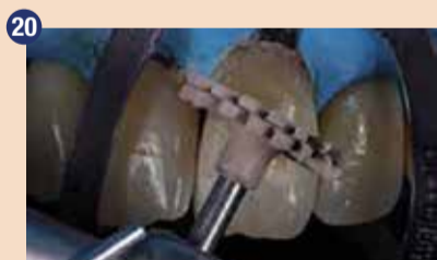
20 Pomembno je, da restavracije finiřiramo in spoliřamo – posebej tiste zraven dlesni – da dosežemo gladko površino, ključno za ohranjanje zdravih parodontalnih tkiv.