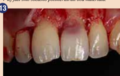
Po dvigu gingivalnega režnja sta se pokazala kaviteta in mehko tkivo, zaradi česar smo lažje očistili področje in namestili izolacijo z gumijasto opno.