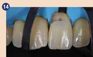
Izolacija iz gumijaste opne štiti operativno področje pred vlago in okužbo.