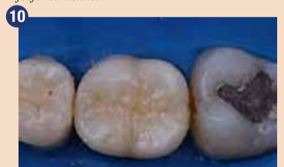
Zaključni sloj G-ænial A'CHORD odtenka JE postvari naravno morfologijo in doda pravilno barvo in svetlost, s čimer smo nadomestili okluzalno sklenino.