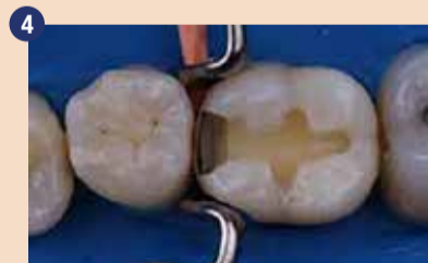
Tipično mezio-okluzalno kaviteto II. razreda smo pripravili.