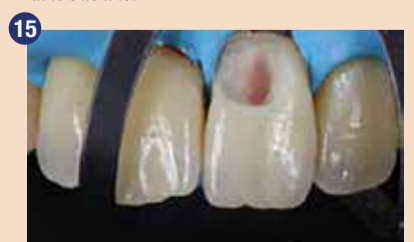
Pomembno je odstraniti sklenino brez opore, saj se s tem izognemo razpokam med polimerizacijo.