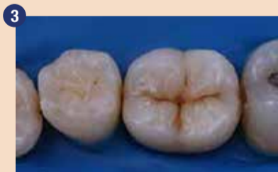
Na prvem mandibularnem molarju smo po radiografiji prepoznali mezialni karies. Okluzalno površino smo na lestvici ICDAS-II ocenili z 03,5.