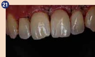
21 Takoj po zaključku direktne restavracije in zaprtju režnja.