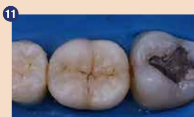
Zobu lahko vdihnemo naraven videz z rahlim zabarvanjem fisur, zaradi česar se restavracije sploh ne opazi več.