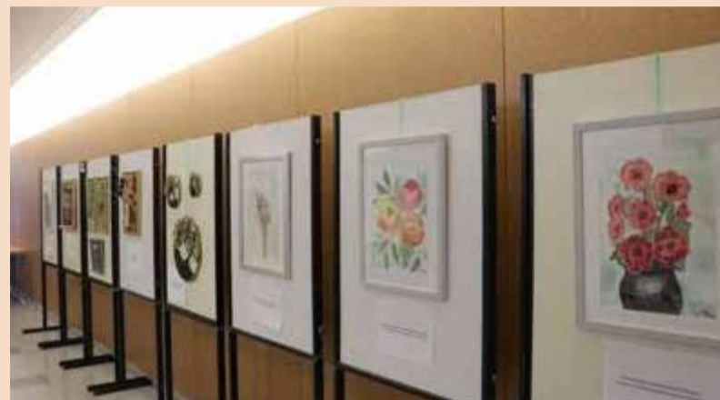
Na seminarju so se udeležencem predstavili nekateri umetniki iz zobnih laboratorijev, ki so svoje oblikovalske sposobnosti prenesli tudi na druga področja ustvarjanja.