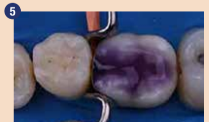
V tem primeru smo izbrali tehniko total-etch (totalno jedkanje). Pred nanosom 1-PRIMERJA na sklenino in dentin smo nanесли gel iz 35 % fosforne kisline.