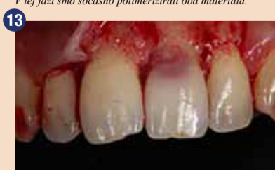
Po dvigu gingivalnega režnja sta se pokazala kaviteta in mehko tkivo, zaradi česar smo lažje očistili področje in namestili izolacijo z gumijasto opno.