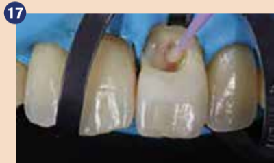
17 Pred presvetljevanjem smo nanесли I-PRIMER in 2-BOND na sklenino in dentin v skladu z navodili proizvajalca.