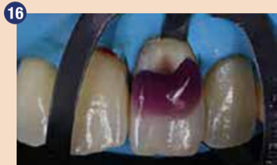
16 Selektivno jedkanje sklenine s 35 % fosforno kislino. Debelina dentina, ki je prekrival pulpo, ni bila večja od 0,3 mm.

»Obj.v GC get connected 19 , s privolj.avt.D.Spagopoulos«