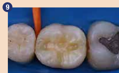
Nanесли smo sloj G-ænial A'CHORD odtenka A4, ki je nadomestil manjkajoči dentinski del.