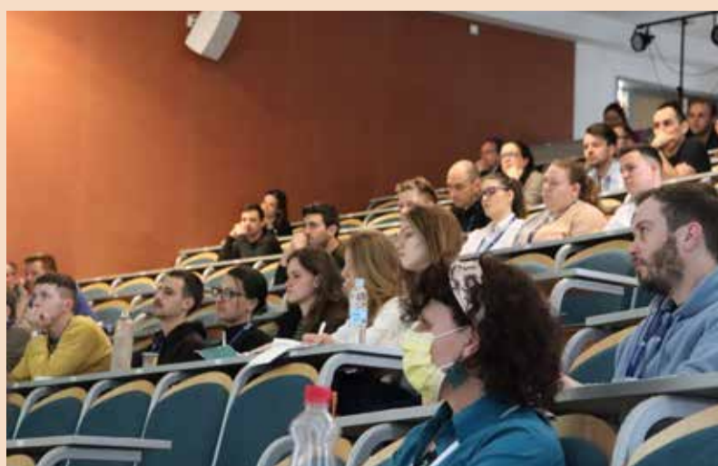
Udeleženci seminarja z zanimanjem spremljajo predavanje v predavalnici.