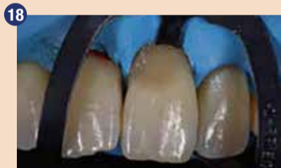
18 Nanos G-aenial A'CHORD odtenka A4 je nadomestil manjkajoči dentin.