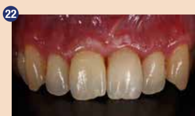
22 Zob smo ponovno ocenili 9 mesecev po operaciji. Tkiva so se zacelila in restavracija se povsem naravno zliva z okolico.