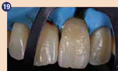
19 Restavracijo smo zaključili z nanosom G-aenial A'CHORD odtenka AE.