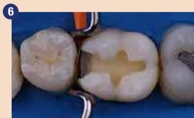
Po jedkanju ima zobni substrat matirano bel videz.