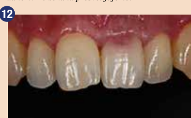
Začetna situacija s suprakrestalno zunanjo resorpcijo na osrednjem sekalcu. Zob je bil še vedno vitalen, zaradi česar smo lahko po dvigu režnja zob direktno restavrirali.