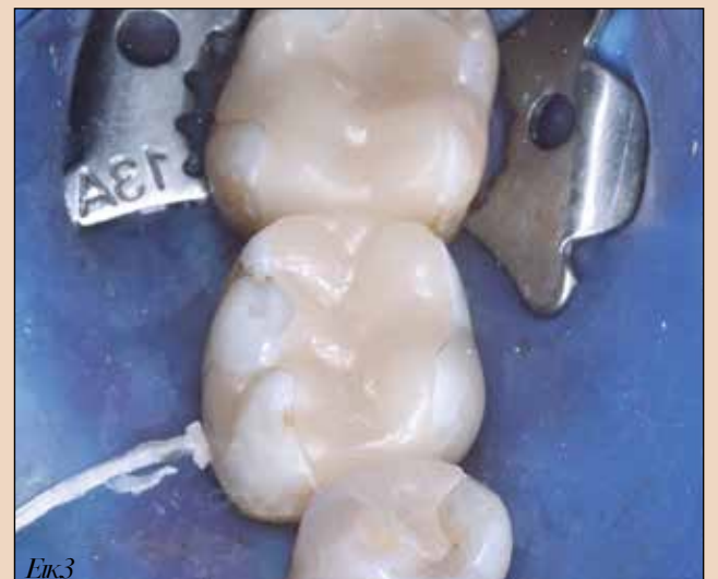
Εικ3. Δοκιμή των ενθέτων.