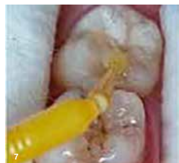
Slika 7: Nanesli smo zaključni sloj EQUIA Forte Coat in ga presvetlili.