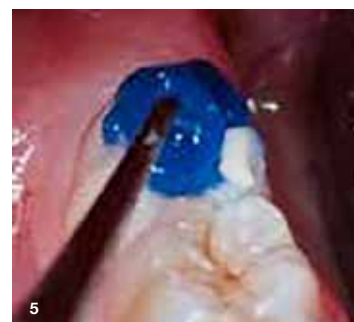
Slika 5: Štempljko smo čvrsto pritisnili v kaviteto, napolnjeno z EQUIA Forte HT, ko je bil material v gumijasti fazi.