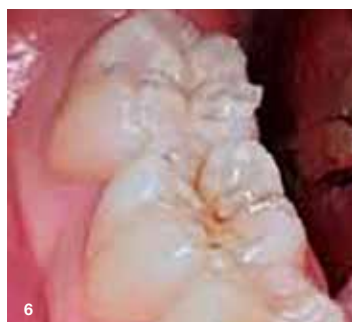
Slika 6: Ko smo odstranili štempljko, se je nemudoma pokazala lepo oblikovana okluzalna anatomija.