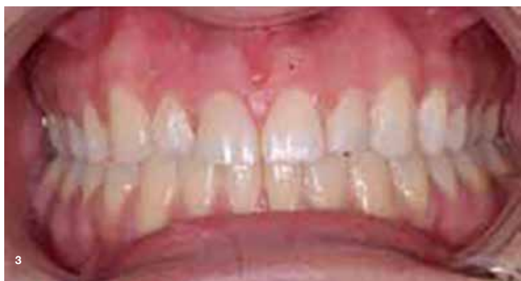
Slika 3: Stanje po restavraciji.