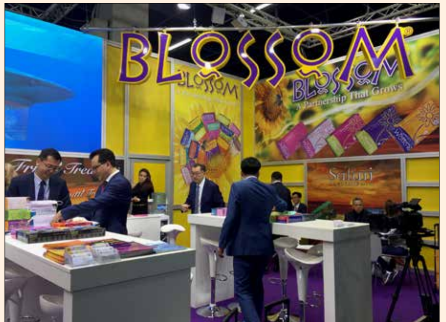
Stand de los guantes Blossom en Colonia.