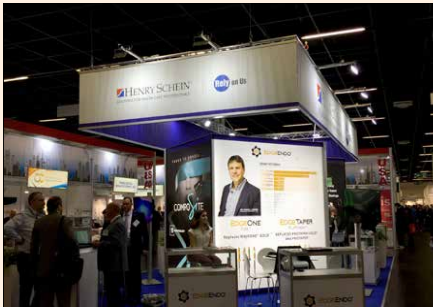
El stand de Hery Schein en el Pabellón USA de IDS.

El mercado de la odontología digital renovó su oferta con dispositivos como los nuevos escáneres intrao-