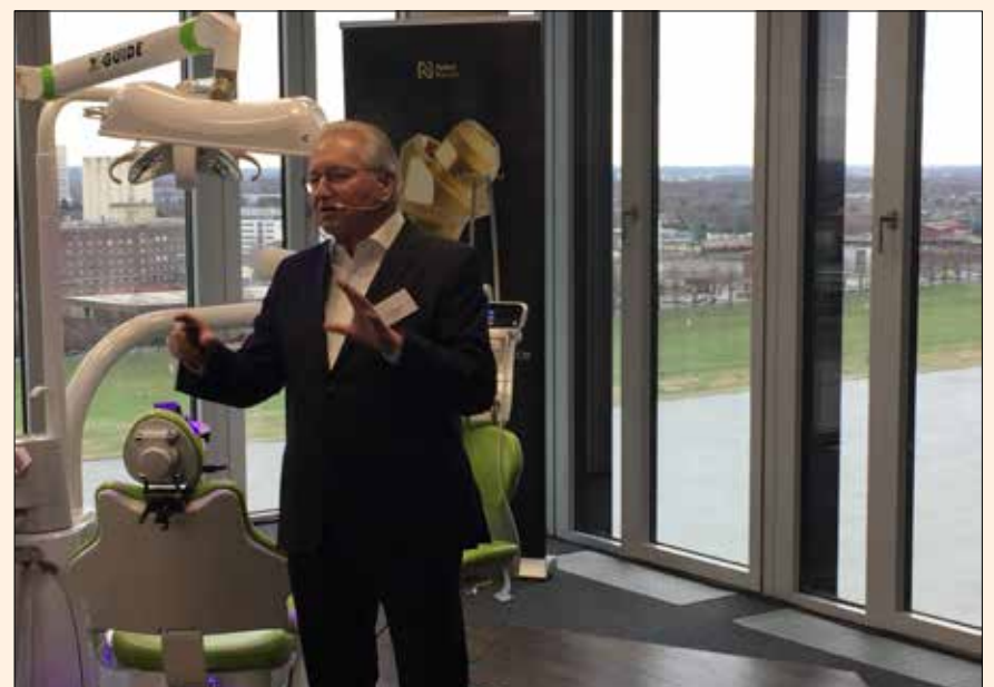
Un momento de la presentación de las superficies Xeal y TiUltra de Nobel Biocare.

Nobel Biocare anunció una nueva era en la implantología oral, bautizada con el nombre de “Mucointegración”, con el lanzamiento de las superficies Xeal y TiUltra en Colonia. Las nuevas superficies, que se pueden aplicar no solo a los implantes sino también a los pilares, han sido creadas para optimizar la integración del tejido a todos los niveles y mejorar los resultados del tratamiento. Basándose en décadas de experiencia en la tecnología de anodización aplicada, Nobel Biocare sabe que para una óptima integración de los implantes dentales se requiere de diferentes superficies para cada tejido. Si bien la osteointegración es fundamental para la función a largo