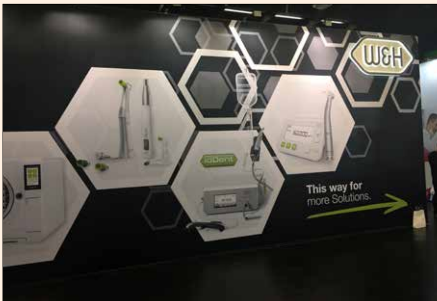
Un anuncio de los productos de W&H en la feria de IDS.