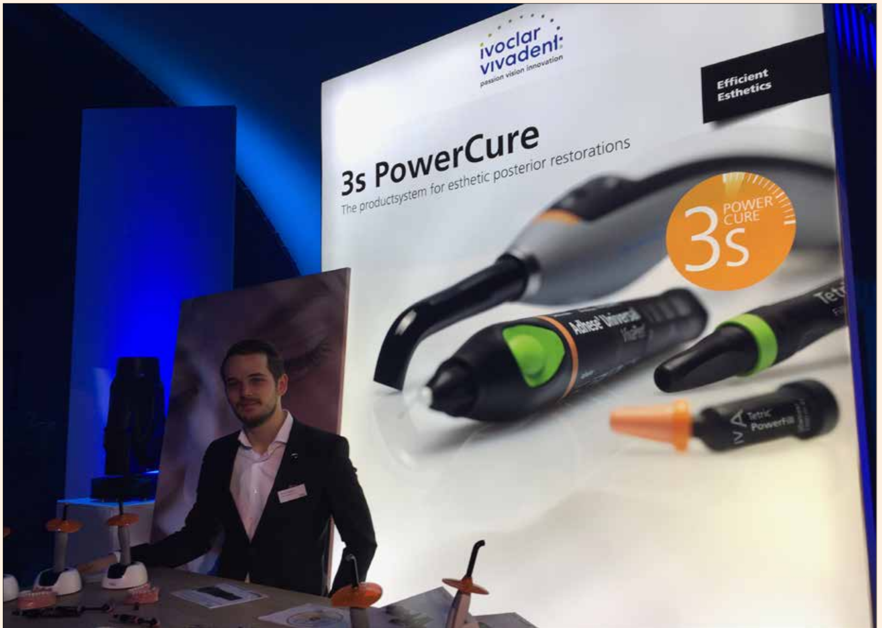
El sistema 3s PowerCure de Ivoclar Vivadent reduce a la mitad el tiempo de tratamiento con la técnica de incremento capas.