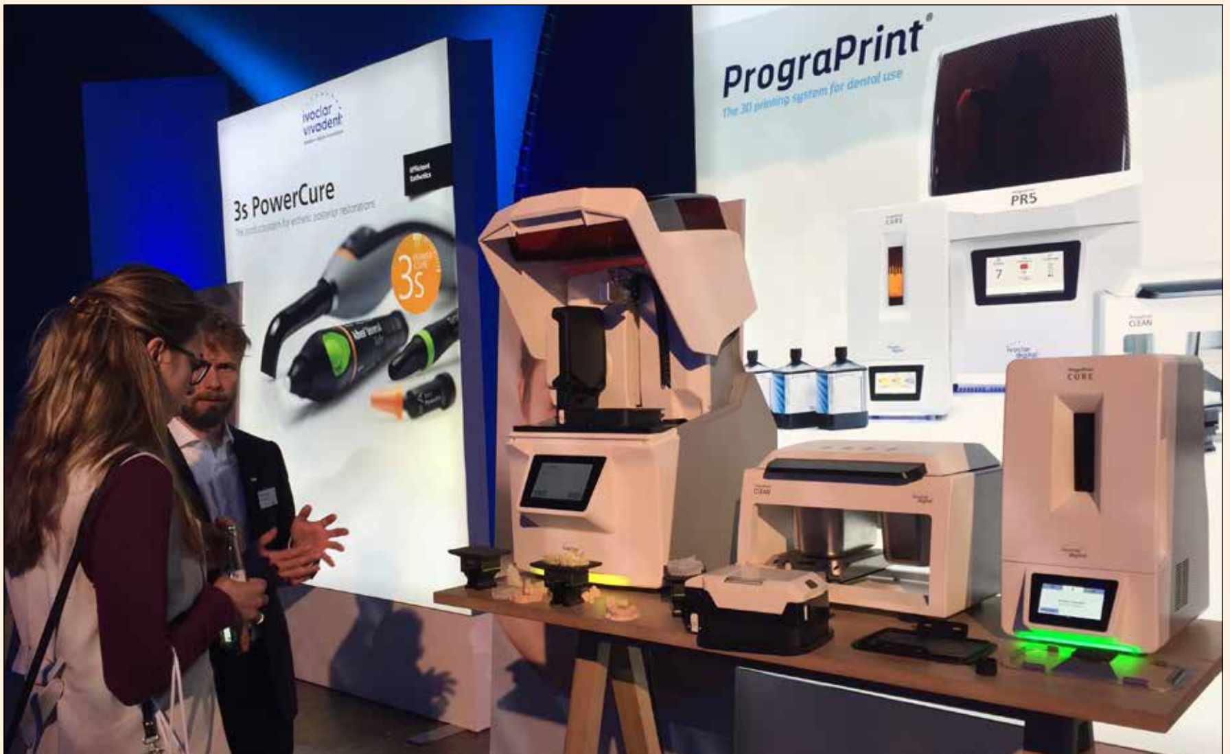
Demostración de PrograPrint, el nuevo sistema de impresión 3D de Ivoclar Vivadent.