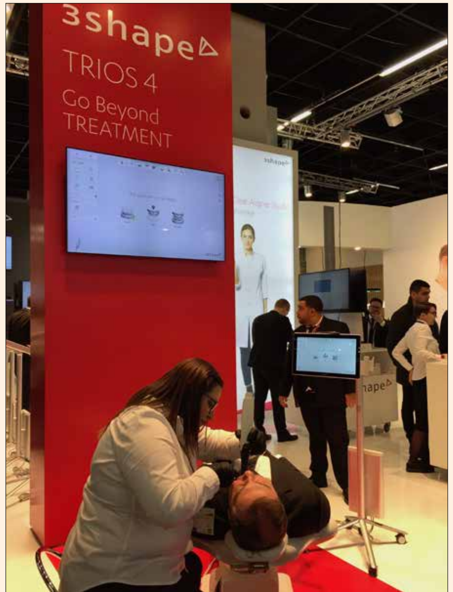
3Shape presentó el Trios4, su nuevo escáner intraoral.

PiC dental ofrece una técnica para tomar la impresión digital de múltiples implantes. El sistema obtiene una impresión precisa independientemente de la cantidad de implantes, sus distancias o angulaciones. Después de la captación de implantes con la cámara de esta empresa y del Registro de tejidos, se fabrica el modelo PiC Master combinando la fresadora de 5 ejes y la impresora 3D para tener todas las ventajas de ambas tecnologías de fabricación. Pic-dental: www.picdental.com/es