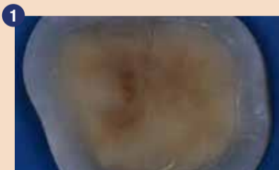
Zob je pripravljen za overlejš. Jasno lahko razločimo zunanji skleninski in notranji dentinski sloj.

Kadar je v kaviteti prisotnega veliko dentina, posebej na njenih marginah, mora biti vezava na dentin karseda trajna in odporna na vodno degradacijo. Močno jedkanje bi razkrilo »mokri« kolagen