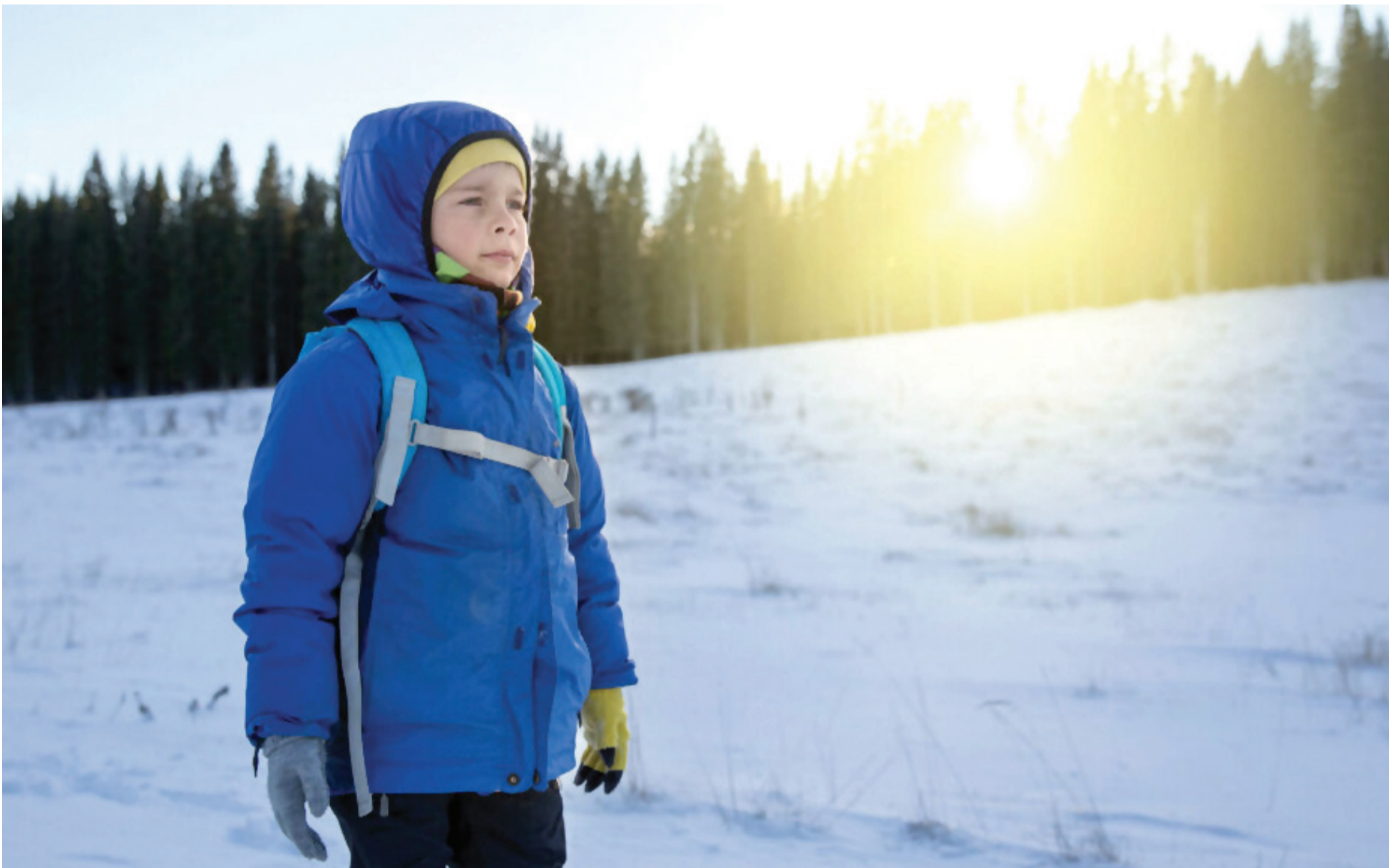
Osobe koje žive u nordijskim zemljama su izložene većem riziku od nedostatka vitamina D zbog nedovoljnog izlaganja suncu.

TRONDHEIM, Norveška: Studija sprovedena u Norveškoj pružila je značajan uvid u kompleksnu interakciju između nivoa vitamina D u serumu i oralnih zdravstvenih problema poput zubnih karijesa i hipomineralizacije molara i ocnjaka (MIH) kod djece. Jasno je utvrđeno da vitamin D igra vitalnu ulogu u mineralizaciji kostiju i da su osobe u nordijskim zemljama izložene povećanom riziku od nižih baznih nivoa vitamina D. Iako direktna povezanost nije definitivno utvrđena, istraživanje ističe važnost uzimanja u obzir nutritivnog statusa kao dijela sveobuhvatne oralne zdravstvene njege i potrebu za daljim istraživanjem u ovoj oblasti.