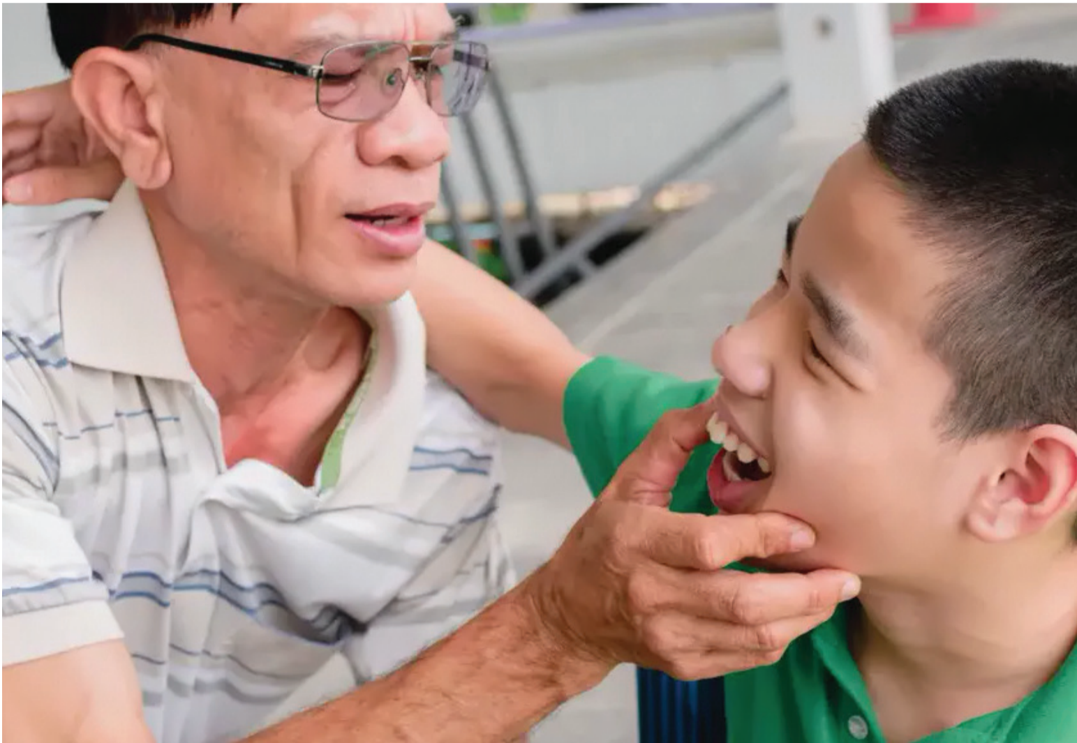
The Canadian Dental Care Plan, plan stomatološke brige, je započeo proširivanjem stomatološkog osiguranja na djecu, starije osobe i osobe sa invaliditetom, pod uslovom da porodični prihod ne prelazi 90.000 kanadskih dolara.

Iako ovaj višestruki pristup traži da vlada na federalnom nivou uloži milijarde dolara, kritičari kažu da plan nije dovoljno dalekosežan.