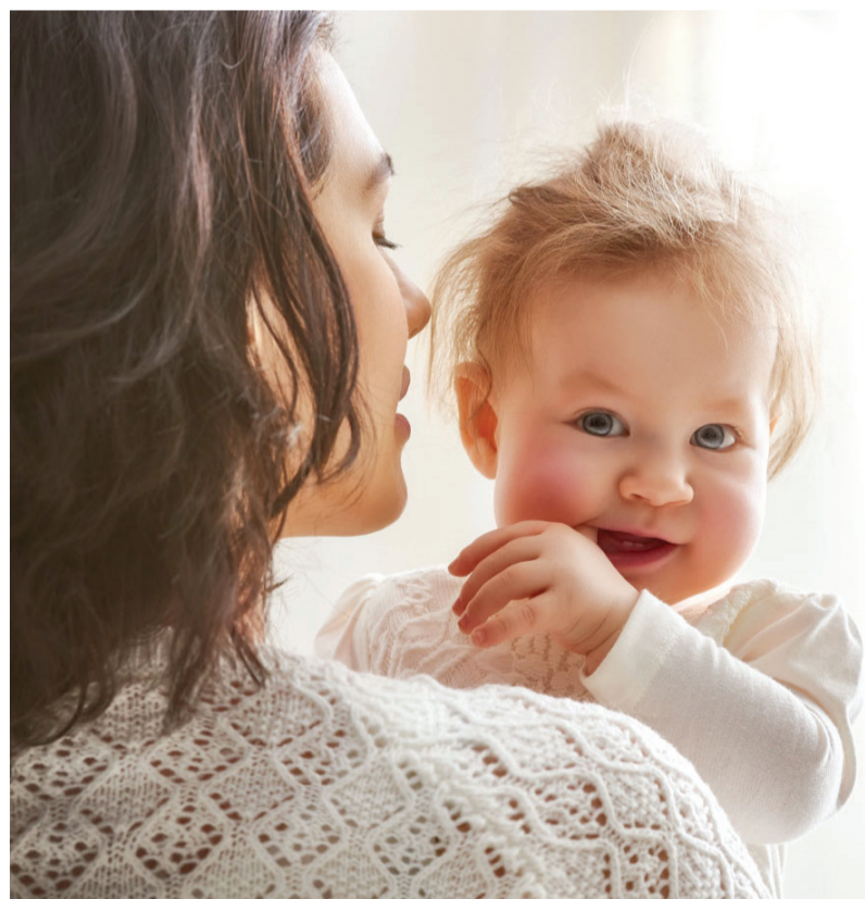
Nova studija je istakla ulogu oralnog zdravlja majki u oralnom zdravlju djece.

Istraživači nisu istraživali tačno kako se gljivica prenosi na bebe. Međutim, hipotetički su pretpostavili da bebe mogu biti izložene tokom porođaja, putem kontakta kože na kožu ili putem hranjenja.