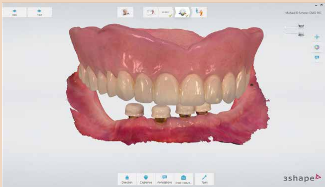
Σάρωση της προσθετικής εργασίας της άνω γνάθου και του αντίθετου τόξου.

Πολλά από τα σπουδαιότερα λογοτεχνικά επιτεύγματα του κόσμου δημιουργήθηκαν με στυλό ή με γραφομηχανή. Και τότε, ήρθαν οι υπολογιστές και το λογισμικό επεξεργασίας κειμένου, όπως το Microsoft Word και το Apple Pages. Παρατήρησε κανείς βελτίωση στην αφήγηση; Μπορεί να είναι ταχύτερα, αλλά τα ψηφιακά εργαλεία δεν διευρύνουν τη φαντασία κανενός· ή μήπως τη διευρύνουν; Οι υπολογιστές βοηθούν τους ανθρώπους να έχουν καλύτερη ορθογραφία και να γράφουν γραμματικά πιο σωστά. Χρησιμοποιώντας τους υπολογιστές, οι άνθρωποι μπορεί να μην έχουν γίνει πιο δημιουργικοί, αλλά σίγουρα έχουν γίνει πιο αποδοτικοί. Τους απελευθέρωσε αυτό ώστε να είναι πιο εκφραστικοί και ευρηματικοί στη συγγραφή τους; Η οδοντιατρική βρίσκεται σε ένα παρόμοιο σταυροδρόμι. Οι τεχνικές της ψηφιακής οδοντιατρικής δεν θα σας κάνουν απαραίτητα καλύτερο οδοντίατρο ή πιο δημιουργικό σε μία νύχτα, αλλά από την εμπειρία μου, θα βελτιώσουν την τεχνική σας και θα κάνουν την οδοντιατρική σας πιο προβλέψιμη και αποδοτική, ακριβώς όπως έκανε ο επεξεργαστής κειμένου για τους συγγραφείς.