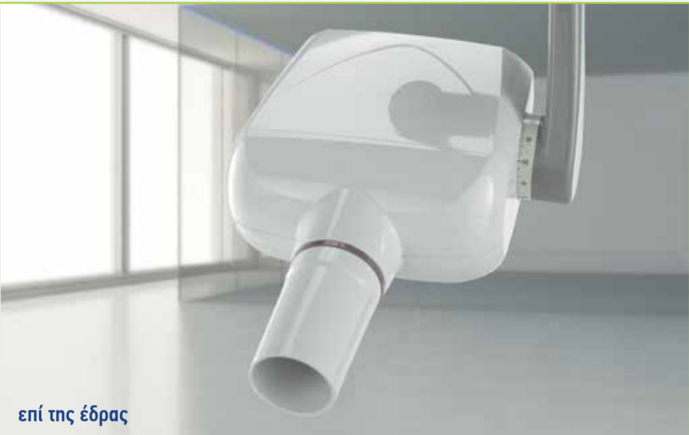
επί της έδρας