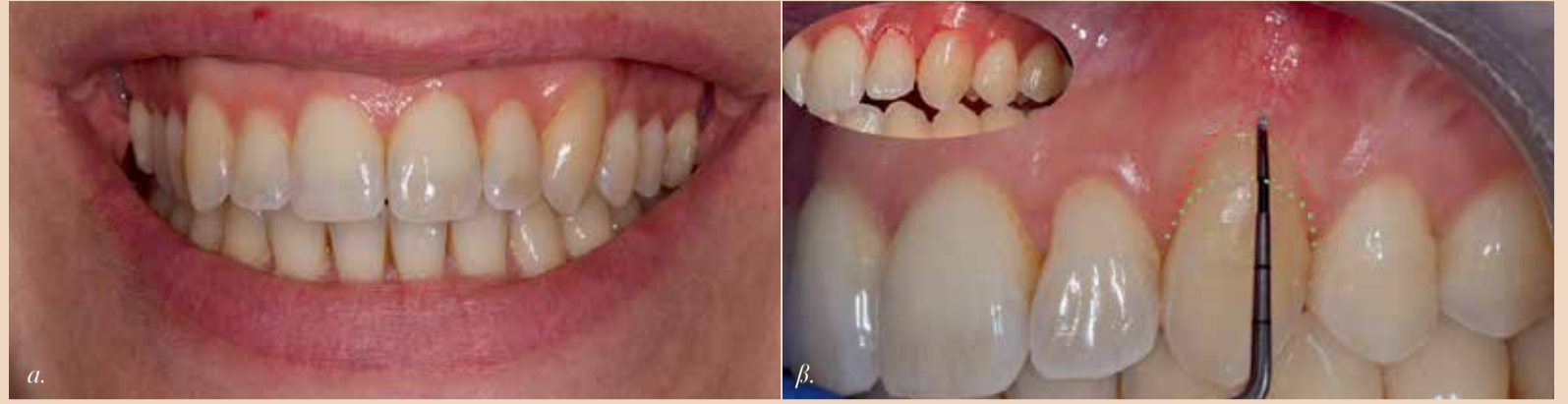
Εικ.5: Η γραμμή γέλιτος σε 1 χρόνο α) γενικό χαμόγελο β) οδοντική αποκάλυψη με υφίζηση

οποία είναι ικανοποιημένη με το τελικό αποτέλεσμα (Εικ.5) Από την πλευρά του πολφού, δεδομένου του θετικού προεγχειρητικού ελέγχου ευαισθησίας, θεωρήθηκε απαραίτητο σε αυτήν την περίπτωση να προσπαθήσουμε να διατηρήσουμε τη ζωτικότητα του δοντιού. Σύμφωνα με τον κλινικό έλεγχο και το ιστορικό πόνου, η εμπλοκή του πολφού φαίνεται να