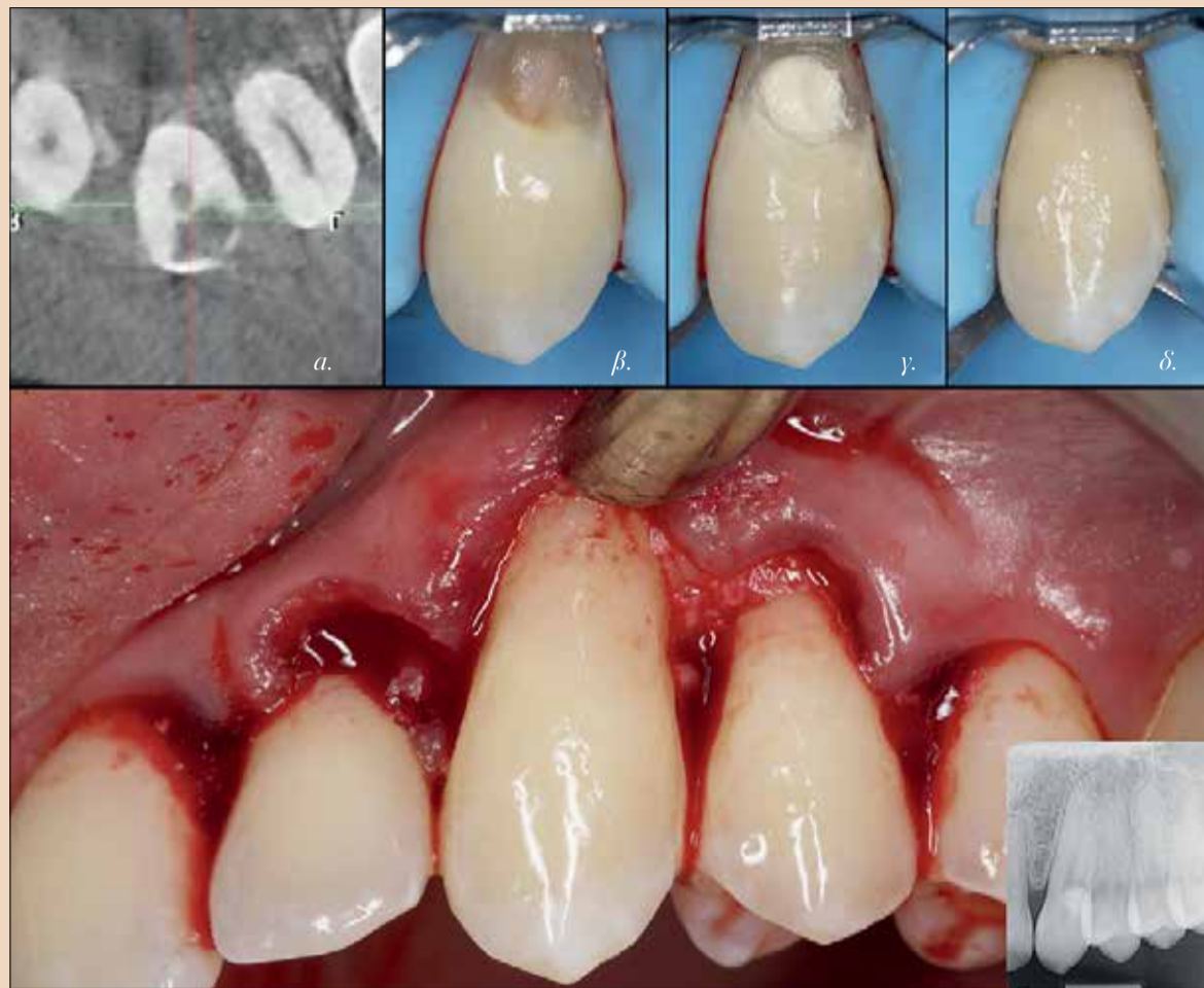
Εικ.3: Θεραπεία ζωντανού πολφού α) 3D επέκταση της απορρόφησης, β) άμεση κάλυψη του PRRS, γ) έμμεση κάλυψη πολφού χρησιμοποιώντας μια επίστρωση Biodentine®, δ) έμφραξη σύνθετης ρητίνης μετά τη στίλβωση

Μετά την οριστική πήξη του Biodentine™, ακολουθεί ένα πρωτόκολλο αυτοαδροποιούμενης συγκόλλησης (Clearfil SE Bond, Kuraray) με επιλεκτική αδροποίηση της αδαμαντίνης με φωσφορικό οξύ 40%, και στη συνέχεια εφαρμόζεται μια πρόσθια έμφραξη σύνθετης ρητίνης (Clearfil