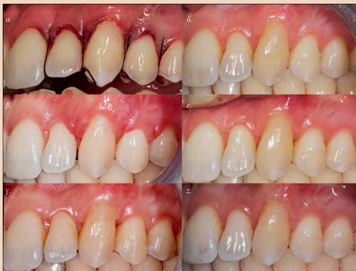
Εικ.4: Η πορεία της επούλωσης των ούλων α) την ημέρα του χειρουργείου, β) μετά από 1 εβδομάδα, γ) 1 μήνα, δ) 3 μήνες, ε) 6 μήνες στ) 1 χρόνο

Majesty, απόχρωση A3, Kuraray) και φωτοπολυμερισμός (Εικ. 3γ). Ο ελαστικός απομονωτήρας αφαιρείται και η σύνθετη ρητίνη στίλβώνεται υπό κατιονισμό νερού (Εικ. 3δ).