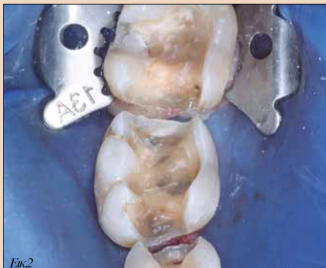
Εικ2. Οδοντικές παρασκευές.