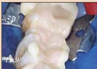
Εικ.9. Αιρέσις μετά την τοποθέτηση - η περίσσεια της κονίας παραμένει στην θέση της για εύκολο καθαρισμό.