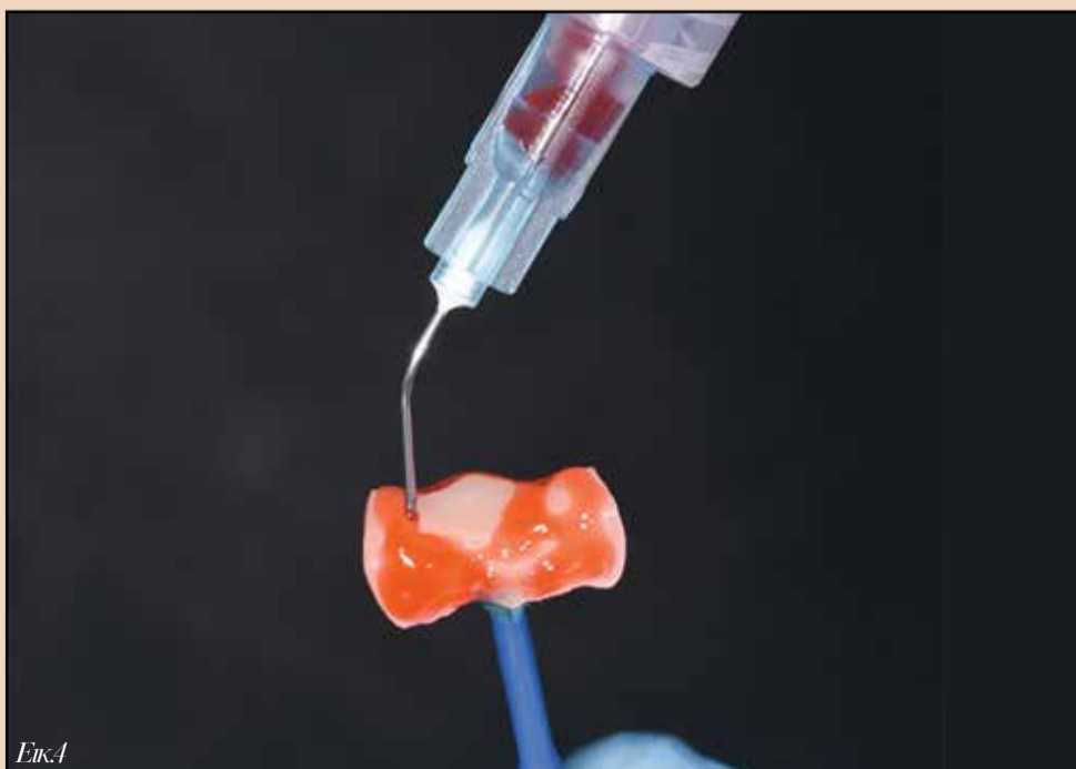
Εικ4. Αδροποίηση με υδροφθορικό οξύ.