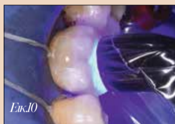
Εικ.10. Τελικός φωτισοπημερισμός με λυχνία φωτισοπημερισμού 3M Elipar DeepCure-S μετά τον καθαρισμό των περισσειών.