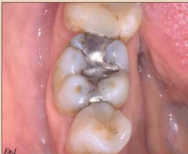
Εικ1. Αρχική κατάσταση.

Ασθενής 46χρονος προσήλθε με δευτερογενή τερηδόνα στους 35, 36 και 37. Τα δόντια αποκαταστάθηκαν με ένθετα CAD/CAM (Straumann nice A2 LT) που κατασκευάστηκαν στο ιατρείο και συγκολλήθηκαν με ρητινώδη κονία γενικής χρήσης 3M RelyX και συγκολλητικό παράγοντα γενικής χρήσης 3M Scotchbond Plus χρησιμοποιώντας την τεχνική της επιλεκτικής αδροποίησης.