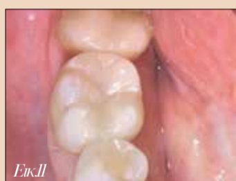
Εικ.11. Τελικό αποτέλεσμα.