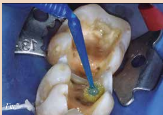
Εικ.7. Τοποθέτηση του συγκολλητικού παράγοντα γενικής χρήσης 3M Scotchbond Plus.