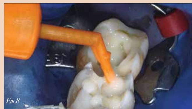
Εικ.8. Τοποθέτηση της ρητινώδους κονίας γενικής χρήσης 3M RelyX μέσα στις κοιλότητες.