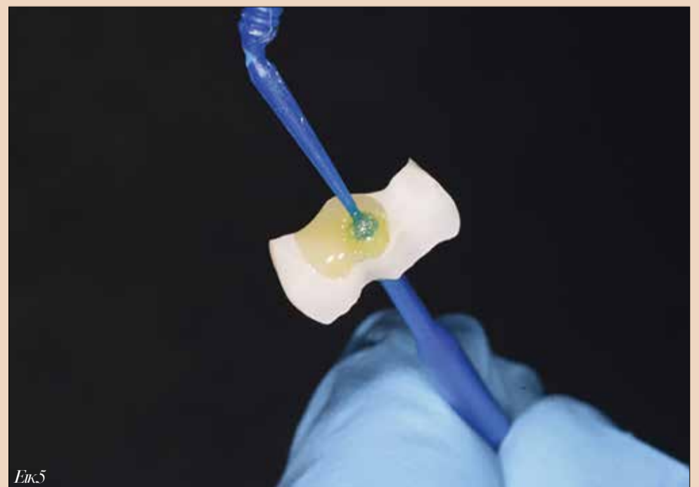
Εικ5. Τοποθέτηση του συγκολλητικού παράγοντα γενικής χρήσης Scotchbond Plus ως primer ούλιανιου.