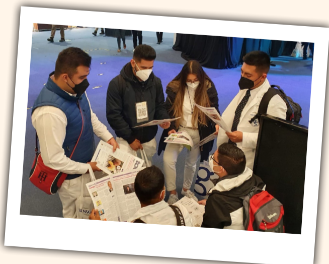
La nueva edición de "today" fue todo un éxito entre los más jóvenes.