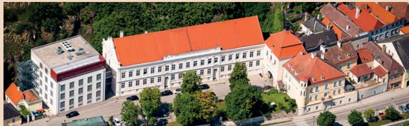
Die Danube Private University: Studieren, wo andere Urlaub machen – in der Weltkultur- und Naturerbelandschaft Wachau