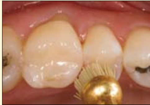
图9: 高度抛光效果可通过橡胶抛光材料来完成, 咬合面抛光刷也可被使用。