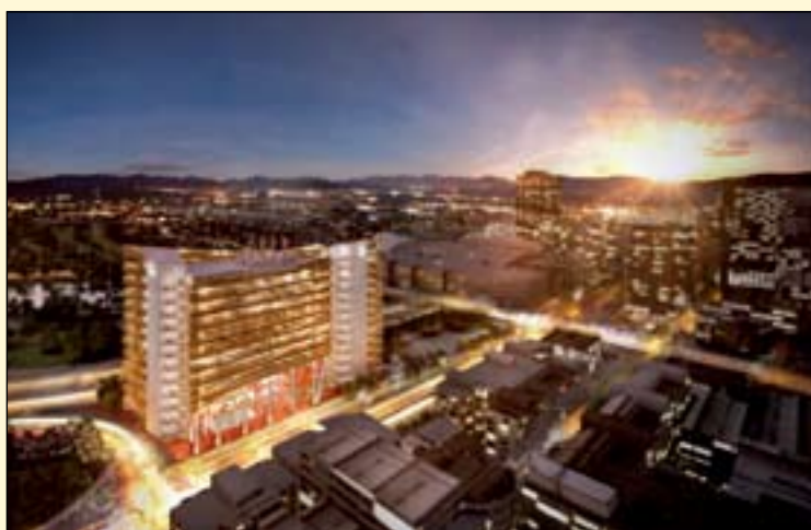
计划于2017年开业的新诊所的模拟图。