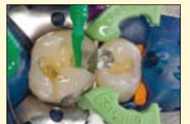
图3：在牙釉质及牙本质表面涂布单瓶装粘接剂GLUMA iBond。