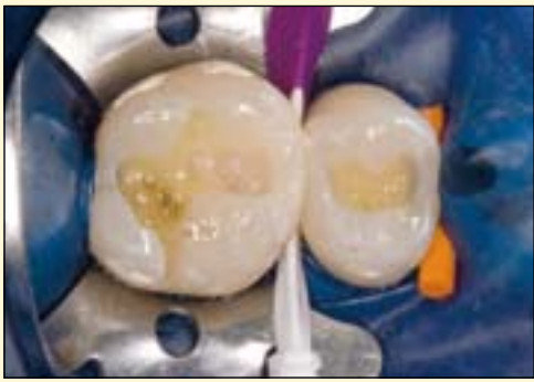
图5: 先用钻石树脂A3进行侧壁及边缘嵴的再建, 使用单色逐层充填技术。在堆塑过程中充分考虑牙体解剖结构形态的再现。