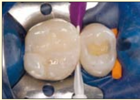
图6: 使用钻石树脂 A3塑造咬合面形态, 树脂具有形态稳定性和极佳的可操作性, 边缘嵴、牙尖、斜面以及沟裂都极易塑形。