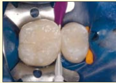
图7: 一次雕塑以及固化之后, 即可在咬合面再现解剖形态及结构。