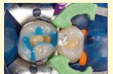
图2：在橡皮障安装后，粘接系统使用全酸蚀剂及冲洗技术：涂布GLUMA Etch 35，先涂布牙釉质区域，再涂布牙本质区域。