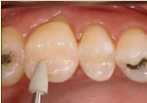
图8: 咬合面修形抛光——先使用精细砂粒的金刚砂车针修形, 之后使用橡胶抛光材料。