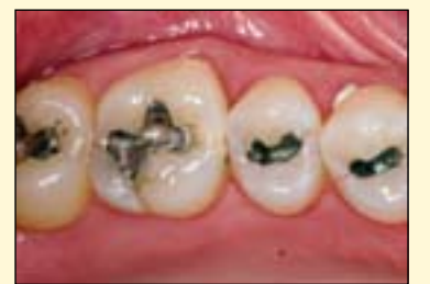
图1：15及16基本情况，可见银汞充填体。临床检查以及牙片显示16近中邻面龋以及15的继发龋。