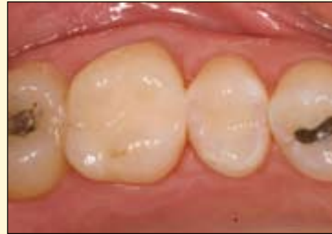
图10: 修复彻底完成后, 高度的光洁效果可以持续存在, 并且通过功能性咬合表面的再现来实现生物力学方面的性能。修复体与牙体之间充分体现了功能与美学的完美匹配。