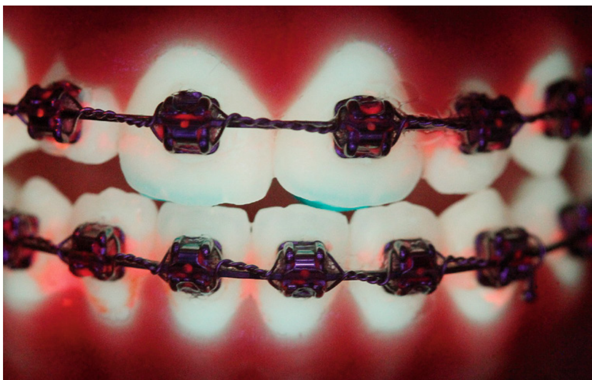
De rode fluorescentievlekken op het QLF-beeld laten zien dat er interdentaal en rondom de orthodontische brackets veel tandplaque zit.