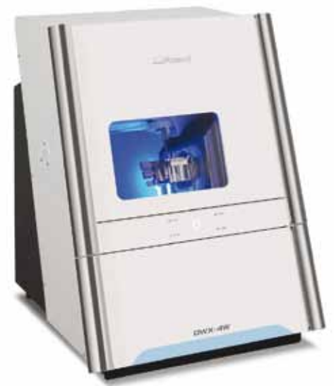
Nueva Fresadora Dental en Húmedo DWX-4W

Para más información sobre las fresadoras dentales DWX, es.rolanddga.com/dwx .