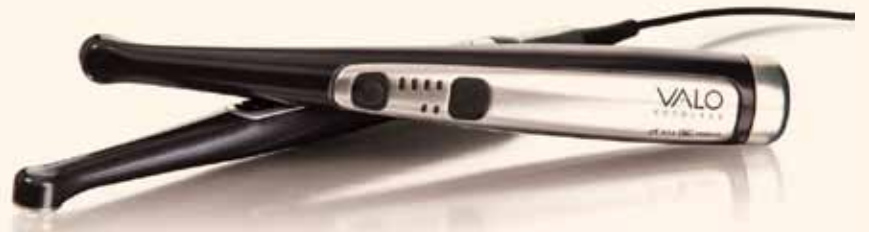
La premiada luz de fotocurado VALO de Ultradent.

sando la conversación sobre cómo operan las prácticas dentales de hoy y las del futuro. Nuestro éxito en llamar la atención sobre estos productos se basa en nuestra fórmula: liderazgo tecnológico en odontología, imparcialidad y no tener fines de lucro».