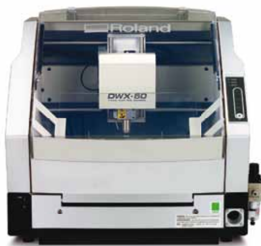
Fresadora DWX-50 de 5 Ejes