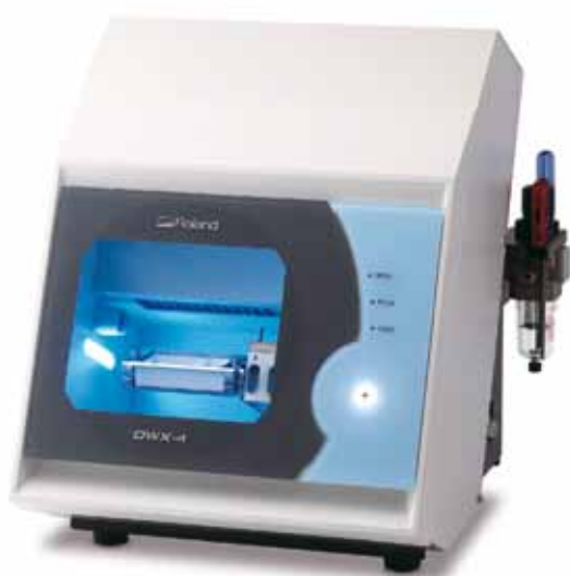
Fresadora Dental Compacta DWX-4

La solución dental EasyShape de Roland es la opción más avanzada y confiable en fresado dental. Merecedora de la confianza de laboratorios y servicios odontológicos en todo el mundo, la serie DWX de máquinas de fresado dedicado en seco y húmedo brinda una solución escalable para garantizar tiempos de producción sin pérdidas al pasar entre entornos secos y húmedos.