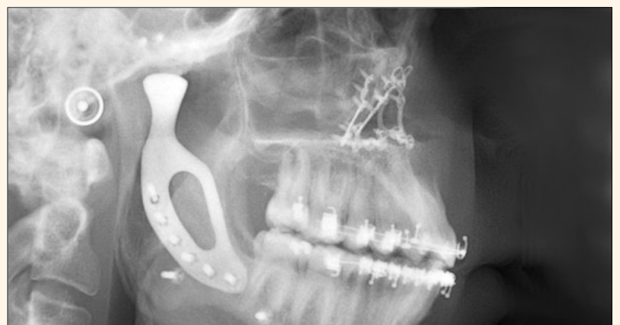
Un paciente con un trastorno de ATM recibió una mandíbula impresa en 3-D