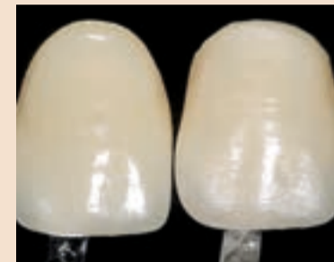
Sl. 3 Slika dva ista ključa boja s drugačijom teksturom površine. Primjetite da je onaj koji ima različitu teksturu percipiran kao različite boje