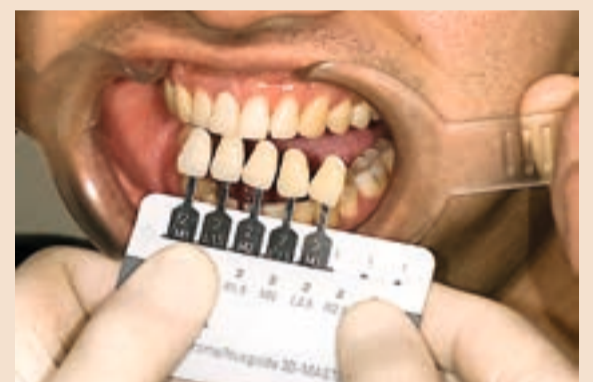
Sl. 13 Slika prikazuje stupnjeve zasićenja s Linearguide