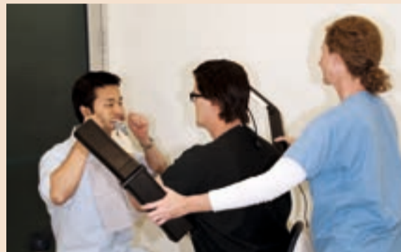
Sl. 1 Korištenje dva OttLites držana u nivou zuba 24 inča od pacijenta za kontrolu temperature svjetlosti