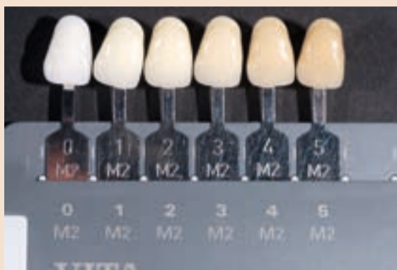
Sl. 10 Linearguide korišten za odabir svjetloće boje