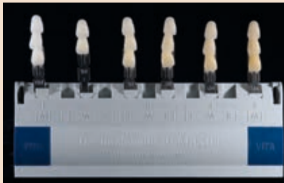
Sl. 8 3D-Master posložen samo s M nijansama vrijednosti od 0 do 5

Nakon raspoređivanja ključa boja prema svjetloći boja, zube i ključ boja lagano smočite s prozirnom glazirajućom tekućinom. Najbolji način za odabir nije odabrati ono prvo što nam se učini kao da je oda-