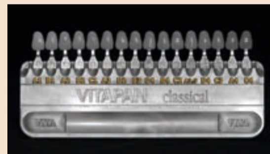
Sl. 5 Classical ključ u crno-bijelom s ispravnim odnosom svjetloće boja