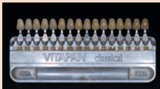
Sl. 4 Classical ključ boja u boji s ispravnim odnosima svjetloće boja. Primjetite kako umeci s različitim zasićenjima boja izgledaju vrlo različito u vrijednosti svjetloća boje

kada govorimo o kontroliranju uvjeta određivanja boje. Kvantiteta svjetla i hidratacija zuba su pritom jednako važne. Osigurajte da prilikom određivanja boje zuba nema očitih sjena koje prekrivaju zub ili ključ boja te da svjetlo nije tako jako kao da želimo kreirati specijalne efekte (reflektorski bijeli krugovi). Također, zubi trebaju ostati hidrirani. Slika se brzo suši, osobito kad imamo retraktore obraza montirane u ustima. Za održavanje zuba vlažnima kao i za ključ boja koristimo prozirnu tekućinu za glaziranje srednjeg viskoziteta (Smile Line Glaze liquid, Smile Line USA). Važno je namočiti oboje budući da razlike u površinskoj teksturi ključa boja i zuba mogu kreirati pogrešnu percepciju. Jednaka tekućina na obje površine u stanju je to neutralizirati (sl. 3).