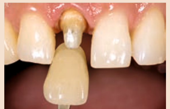
Sl. 15 Slika hidratiziranog zuba s ključem boja

bir, nego prvo odabirati očigledna nepodudaranja u boji i njih eliminirati iz ključa boja. Cilj je eliminirati dovoljno boja tako da imate preostali raspon boja u kojem je sigurno jedna boja malo više vrijednosti svjetloće, a druga malo niže vrijednosti svjetloće boje. Iskustvo je pokazalo da manje od četiri boje neće postići taj raspon u određivanju svjetloće boje. (sl. 6)