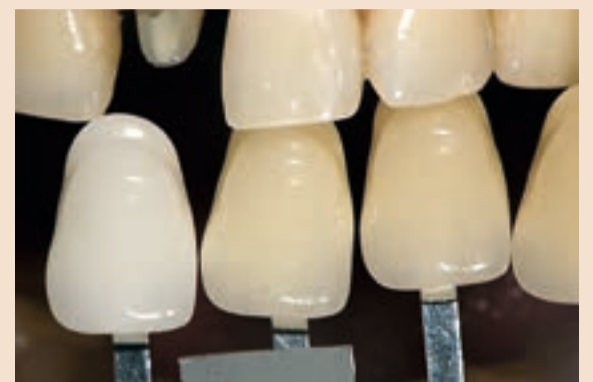
Sl. 11 Korištenje Linearguide za određivanje svjetloće