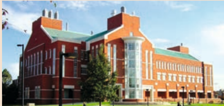
Donald Demuth, PhD sa Sveučilišta u Louisvillu je dobio patent za nova biokemijska otkrića.