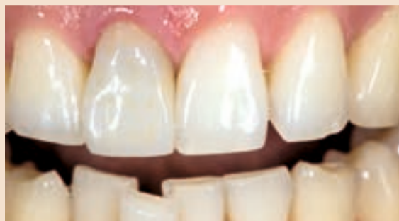
Sl. 19 Pre-op slika krunice za koju se pacijent žalio da je bila preniske vrijednosti u svjetloći boje