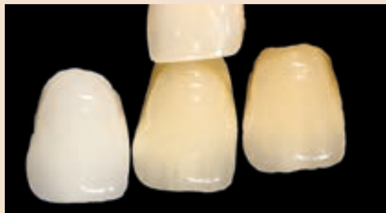
Sl. 17 Slika s pozadinom neutraliziranom u Photoshopu. Mnogo je lakše procijeniti boju

O ovoj će se tehnici raspravljati kasnije. Četvrta slika (sl. 15) je slika hidriranog prepariranog zuba s odabranom približno jednakom