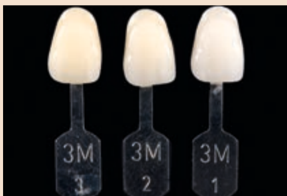
Sl. 12 Slika prikazuje stupnjeve zasićenja boja s 3D-Master ključem