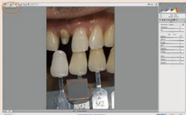
Sl. 16_Slika Camera Raw u Photoshopu. Balans bijele boje aktivira se klikanjem i potom se klikne na sivu karticu. Ovo će neutralizirati model boja