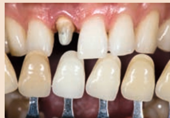
Sl. 7 Korištenje Classical ključa za odabir stupnja zasićenja boje