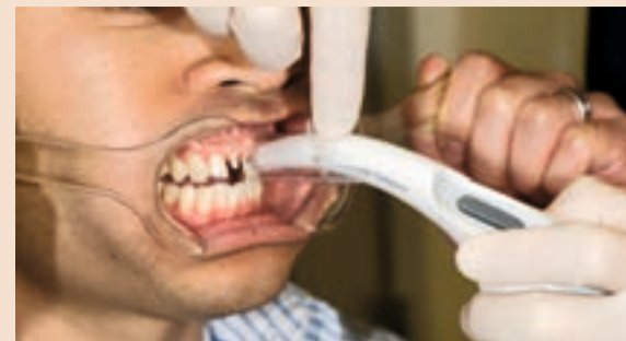
Sl. 18 Slika korištenjem Easysshade Compact