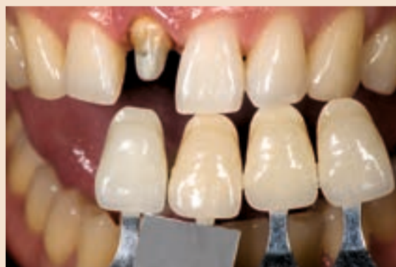
Sl. 6 Korištenje Classical ključa boja prema rasporedu svjetloće boja i rad procesom eliminacije za postizanje četiri boje koje pokrivaju raspon boje zuba koji se procjenjuje