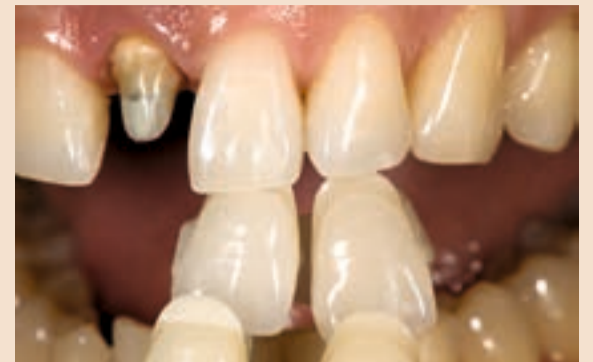
Sl. 9 Odabir svjetloće za ovaj slučaj