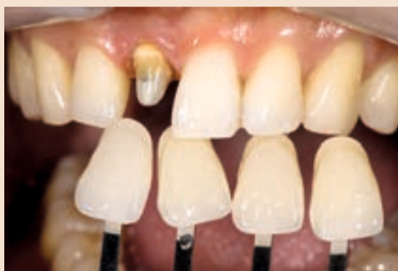
Sl. 14 Odabir zasićenja boje za pacijentov slučaj. Ista se slika može koristiti za određivanje jesu li zubi crveniji ili više žuti od onog što je pokazala M grupa tona boje