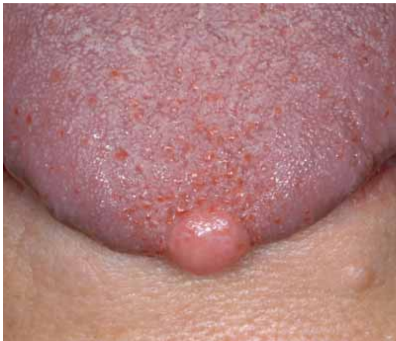
Afbeelding 43 Fibroom van de tongpunt.

Cheilitis granulomatosa doet zich voor als een geleidelijk ontstane (in tegenstelling tot de plotseling optredende zwelling bij het angio-oedeem) en soms recidiverende, al of niet pijnlijke, diffuse zwelling van de boven- en/of onderlip. De etiologie is onbekend. Meestal kan de diagnose op verantwoorde wijze op alleen klinisch-anamnestiche gronden worden gesteld. Bij twijfel