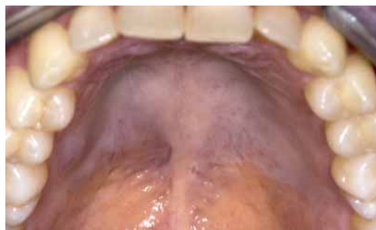
Afbeelding 51 Kaposi-sarcoom.