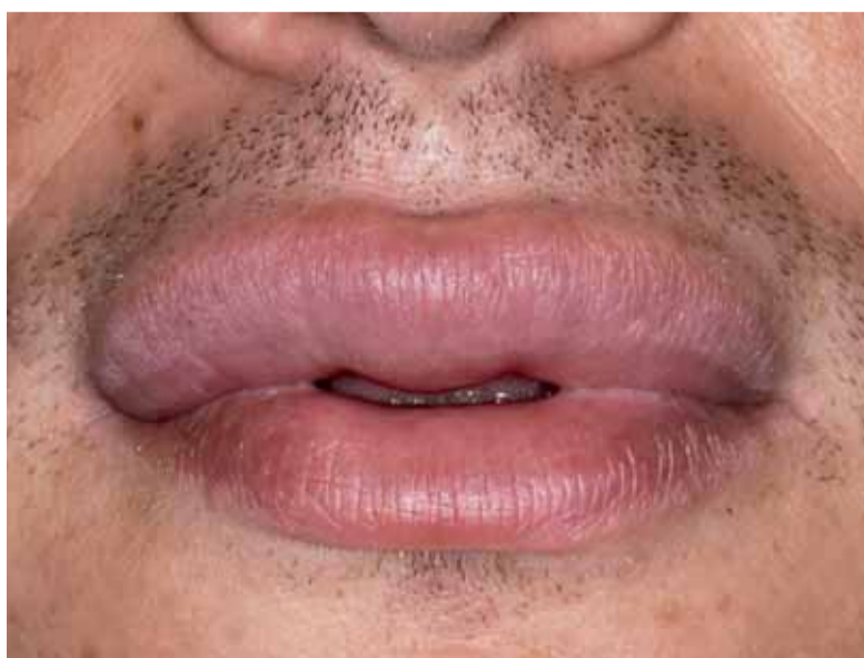
Afbeelding 42 Cheilitis granulomatosa van de bovenlip.