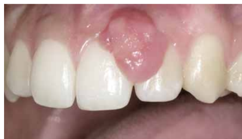
Afbeelding 44 Epulis.