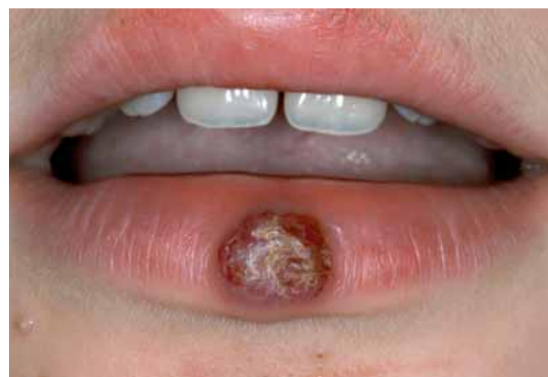
Afbeelding 45 Granuloma pyogenicum.