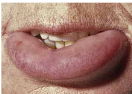
Afbeelding 41 Angio-oedeem van de onderlip.

De naam van de afwijking stamt nog uit de tijd dat werd gedacht dat een bepaalde pusvormende bacterie de veroorzaker was. Een granuloma pyogenicum komt vooral bij jongvolwassenen voor en kan zich overal in