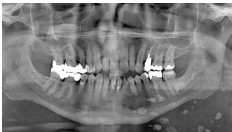
Afbeelding 47 Flebolieten.