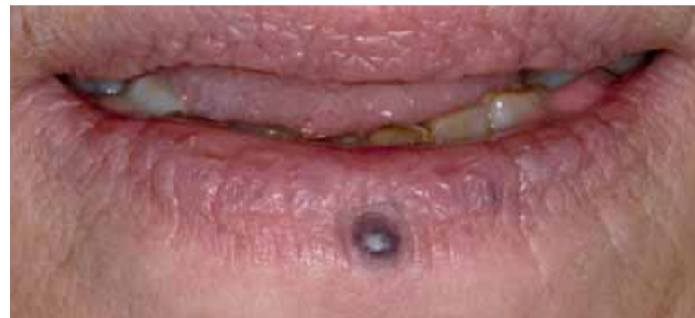
Afbeelding 50 Flebectasie.