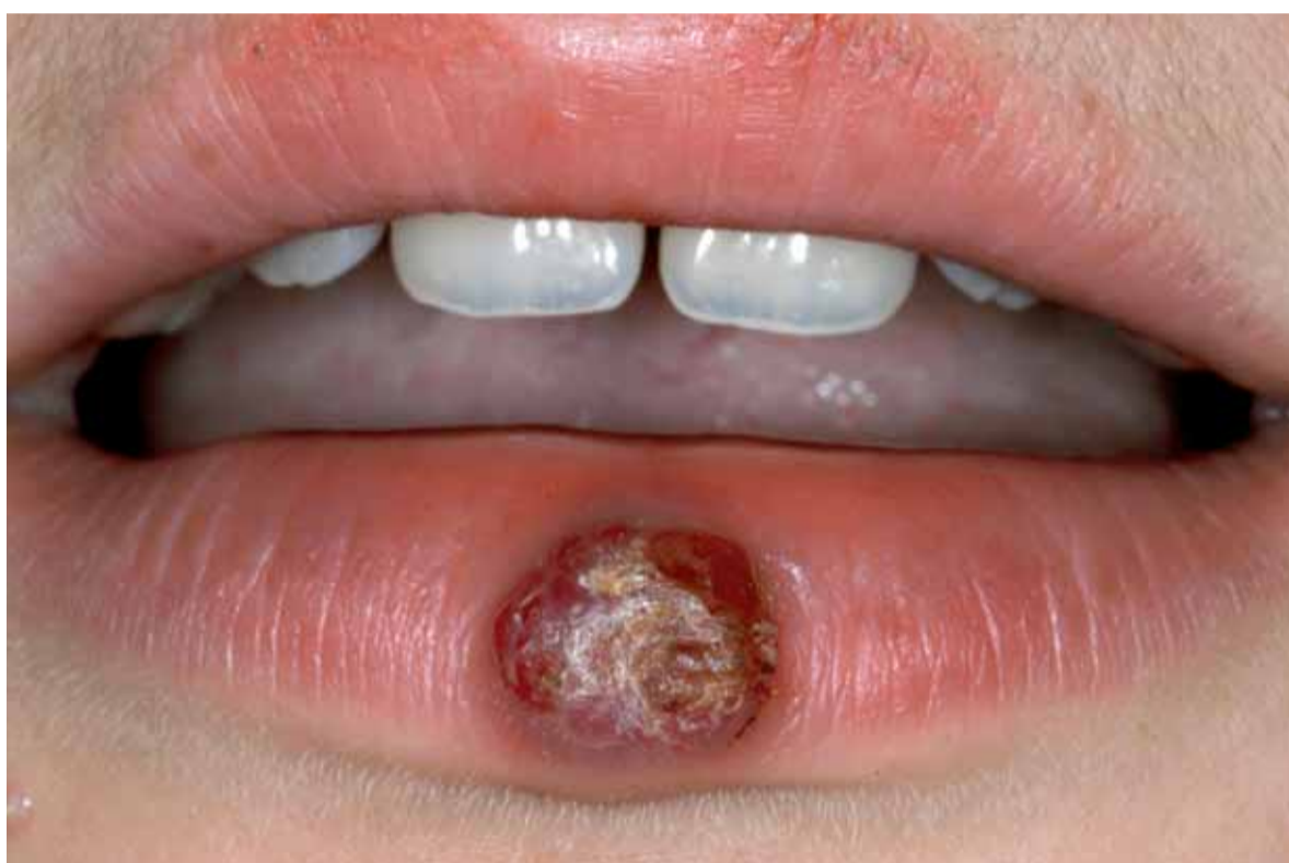
Granuloma pyogenicum, een excessieve weefselreactie op een weefselbeschadiging.