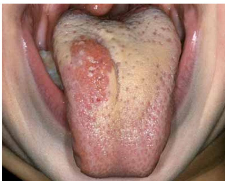
Afbeelding 48 Lymfangioom.

de mond en de lippen voordoen. Meestal betreft het een enigszins op een fibroom gelijkende, niet-pijnlijke, gesteelde, rode en week aanvoelende zwelling met een ulcererend oppervlak. In principe wordt altijd tot excisie overgegaan, omdat de diagnose ook dan pas met zekerheid kan worden gesteld op grond van het histopathologische beeld. Dit bestaat uit een weinig kenmerkend ontstekingsbeeld met een sterke vaatproliferatie. Na excisie treedt zelden recidief op.