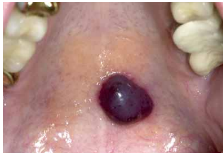
Afbeelding 49 Bloedblaar.

Wanneer het om een solitaire laesie gaat, kan deze chirurgisch worden verwijderd. In andere gevallen wordt gebruikgemaakt van bestraling of (intralesionale) chemotherapie. ■