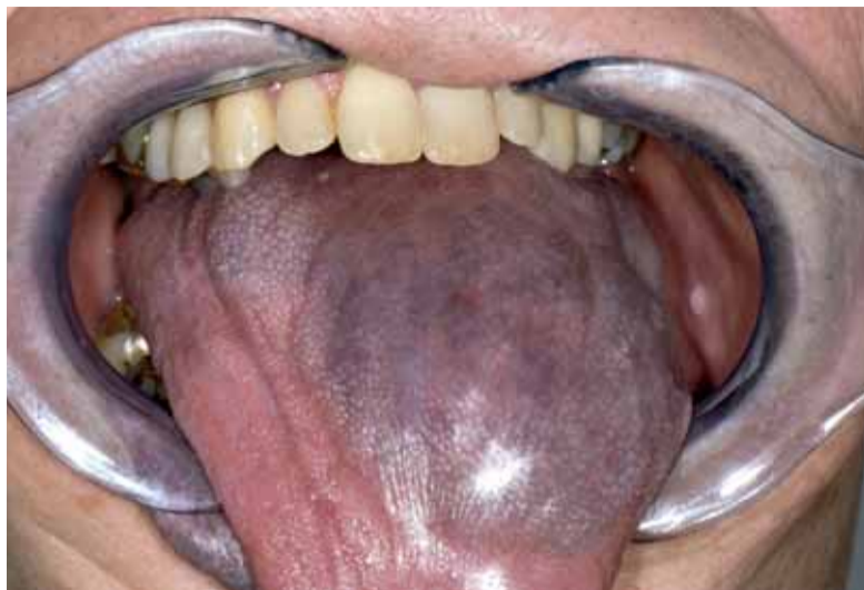
Afbeelding 46 Veneuze malformatie van de tong.