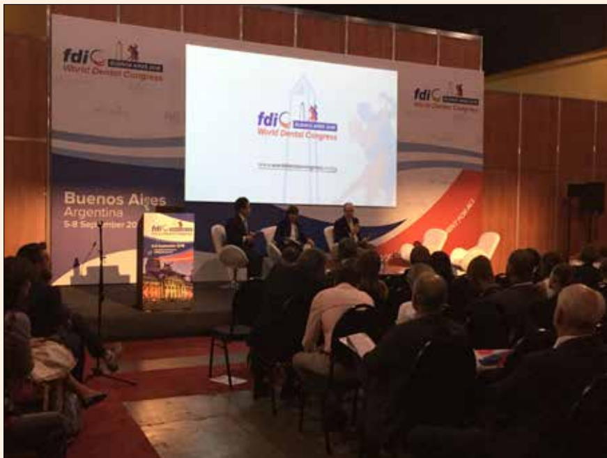
Uno de los múltiples foros de en FDI Buenos Aires.