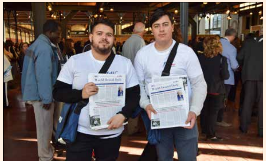
Dental Tribune, socio para comunicaciones de FDI, editó y repartió tres ediciones del periódico diario «FDI World Dental Daily» en Buenos Aires.

Suscríbase gratis por 6 meses a la edición digital de