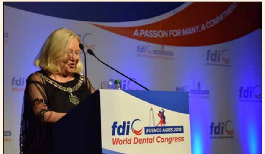
La Dra. Kathryn Kell, Presidenta de FDI, durante el discurso de inauguración de FDI Buenos Aires.