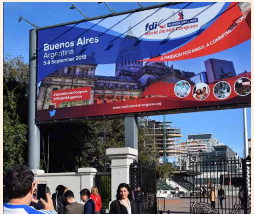
La entrada a La Rural en Buenos Aires, donde se celebró el Congreso Dental Mundial de FDI.