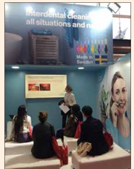
En el stand de la empresa sueca TePe se impartieron cursos sobre higiene interdental.