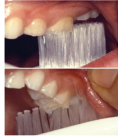
Tijdens de doorbraak wordt het element overgeslagen als de tandenborstel in de lengterichting op de tandboog wordt geplaatst. Als je de borstel dwars op de tandboog zet, is adequate reiniging mogelijk.