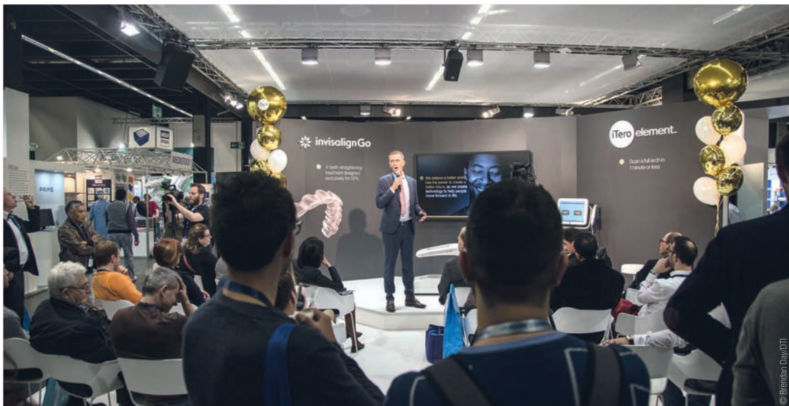
Launch of the Made to Move campaign on Wednesday.