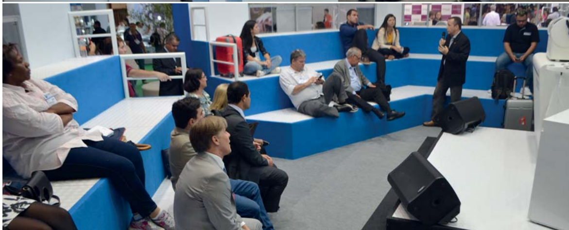
Arena orienta o profissional da Odontologia sobre assuntos importantes do seu cotidiano.