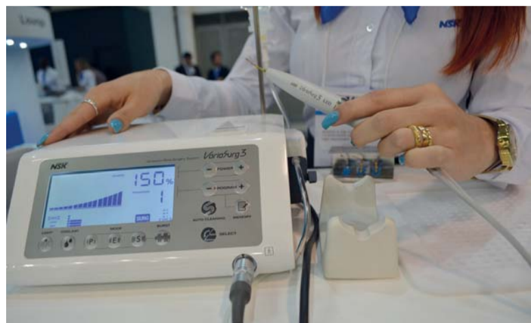
↑NSK apresenta o Motor Vario Surg 3 em seu estande no CIOSP.