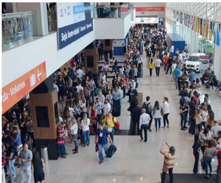
*Movimentação no evento é cada ano mais crescente, reunindo um público que vem de várias partes do mundo.

Para os representantes da Associação dos Técnicos Dentários de Campinas