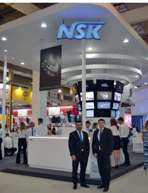
↑Estande NSK no 36º CIOSP.