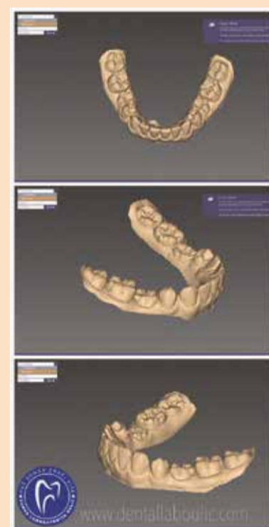
Slika 4: Slučaj anodoncije drugih premolara u donjoj vilici, obostrano. Izgled intra oralnog skena u exocad-ovom dental CAD programu. Ordinacija Veljkov, dr Dejan Veljkov.

Nakon uzimanja intraoralnog digitalnog otiska – „skena“ (intraoralnim skenerom Medit i500) gornje i donje vilice, kao i odnosa zuba u okluziji, dobijamo kompletno formiran slučaj na intaktnim i ne brušenim zubima. (Slika 4).