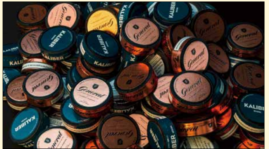
根据美国食品和药物管理局称，从香烟向授权无烟烟草产品的彻底转型可以降低某些口腔疾病和一般健康问题风险。

自1992年以来，除瑞典外，所有欧盟成员国都禁止销售鼻烟。2018年11月，欧盟法院驳回了对该禁令的指控。DT