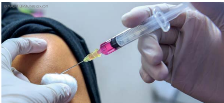
♦ Vacinação gratuita é oferecida a todo o público do CIOSP.

Adulto (Difteria e Tétano) e Febre Amarela. Quem perdeu ou estiver sem o documento de vacinação no momento também poderá usufruir dessa facilidade, bastando relatar sobre seu histórico de saúde durante uma breve entrevista. ◀