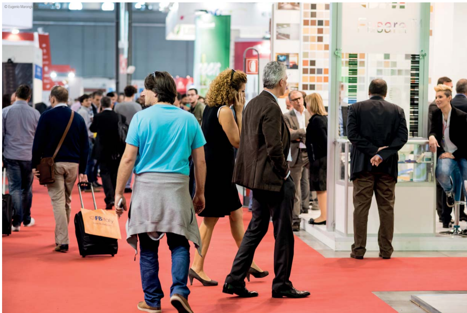
^ A expectativa é que cerca de 100 mil profissionais passem pelo CIOSP este ano.

O título das coletâneas são: Harmonização Orofacial - A outra face da Odontologia - tomo 2; Odontologia de Mínima Intervenção - Dentes funcionais por toda a vida!; Ortopedia Funcional dos Maxilares - Pesquisa e excelência clínica; Tecnologias e Técnicas Endodônticas - Em busca da desinfecção ideal - Blindagem; Terapêuticas Infecções Odontológicas - Farmacologia para a prática clínica; Expansão Rápida da Maxila - Uso clínico em adultos.