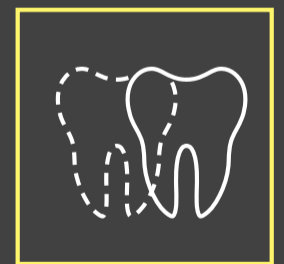
Possibilidade de simulação