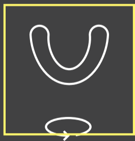
Impressões digitais 3D

O novo iTero Element 5D é mais do que um scanner. É o primeiro sistema híbrido de imagem dental que registra simultaneamente imagens 3D, NIRI (near-infrared imaging) e intraorais coloridas, além de permitir a comparação ao longo do tempo usando a tecnologia iTero TimeLapse .