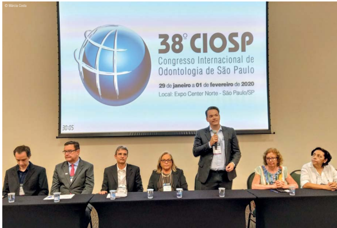
↳ Mesa de debate sobre Saúde Coletiva

Na mesa 2, à tarde, “Desafios da construção da rede de atenção ao câncer bucal: o papel do comitê estadual”, discutiu-se a proposta de criar um comitê estadual sobre o tema. “O câncer bucal é grave. Cerca de 5 mil pessoas por ano morrem de câncer de boca no Brasil. Entre os homens este é o quarto