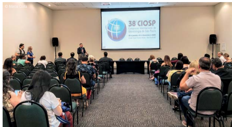
• Abertura dos debates do Projeto Saúde Coletiva.

A primeira mesa, intitulada “O sistema único de saúde: as eleições e a saúde bucal nos municípios”, discutiu a 16ª Conferência Nacional de Saúde e os desdobramentos para a saúde bucal, as propostas de mudanças no SUS e os possíveis efeitos na saúde bucal, as eleições municipais e os compromissos dos candidatos. A ideia foi refletir sobre como expandir a promoção da saúde, a prevenção de doenças bucais e assegurar a assistência odontológica nos municípios.