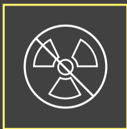
Sem exposição à radiação