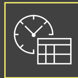
Tecnologia iTero TimeLapse em tempo real