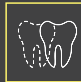
Possibilidade de simulação