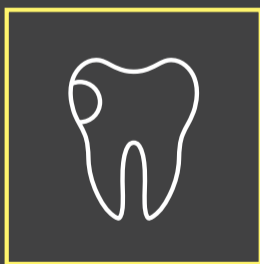
Auxílio na detecção de cáries proximais