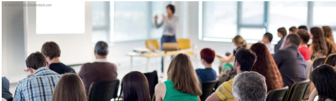
♦ Grade científica traz a vanguarda do pensamento odontológico.