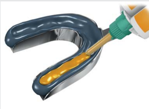
▲ Aplicação do material na moldeira após remoção da ponta com cânula metálica acoplada