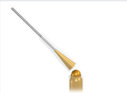
▲ Separação da cânula do corpo da ponta misturadora MIXPAC T-Mixer Colibri plus breakable através de ruptura da linha presente no corpo da ponta misturadora para aplicação do material na moldeira