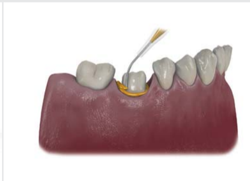
▲ Ponta misturadora MIXPAC T-Mixer Colibri plus breakable sendo utilizada para aplicação do material