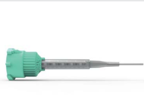
▲ Ponta misturadora MIXPAC T-Mixer Colibri plus breakable

A principal diferença é nosso modelo de negócios com abordagem 360°. Nosso ambiente de produção com certificação ISO e tecnologia de ponta, combinados à utilização das melhores matérias-primas e processos extensivos de qualidade, tornam a Sulzer resultado de uma fusão efetiva entre a Qualidade suíça com a Engenharia alemã presentes em todo o processo produtivo. ◀