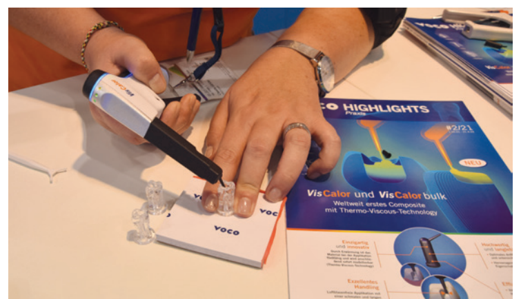
•Produkt demonstration des VisCalor-Komposits. •Product demonstration of the VisCalor composite.

At IDS, we are concentrating on our new VisCalor product. It is the first composite in the world to feature thermally controlled viscosity behaviour. At the last IDS, we presented VisCalor Bulk, so we are now expanding our product range. It is available in various VITA shades, allowing the