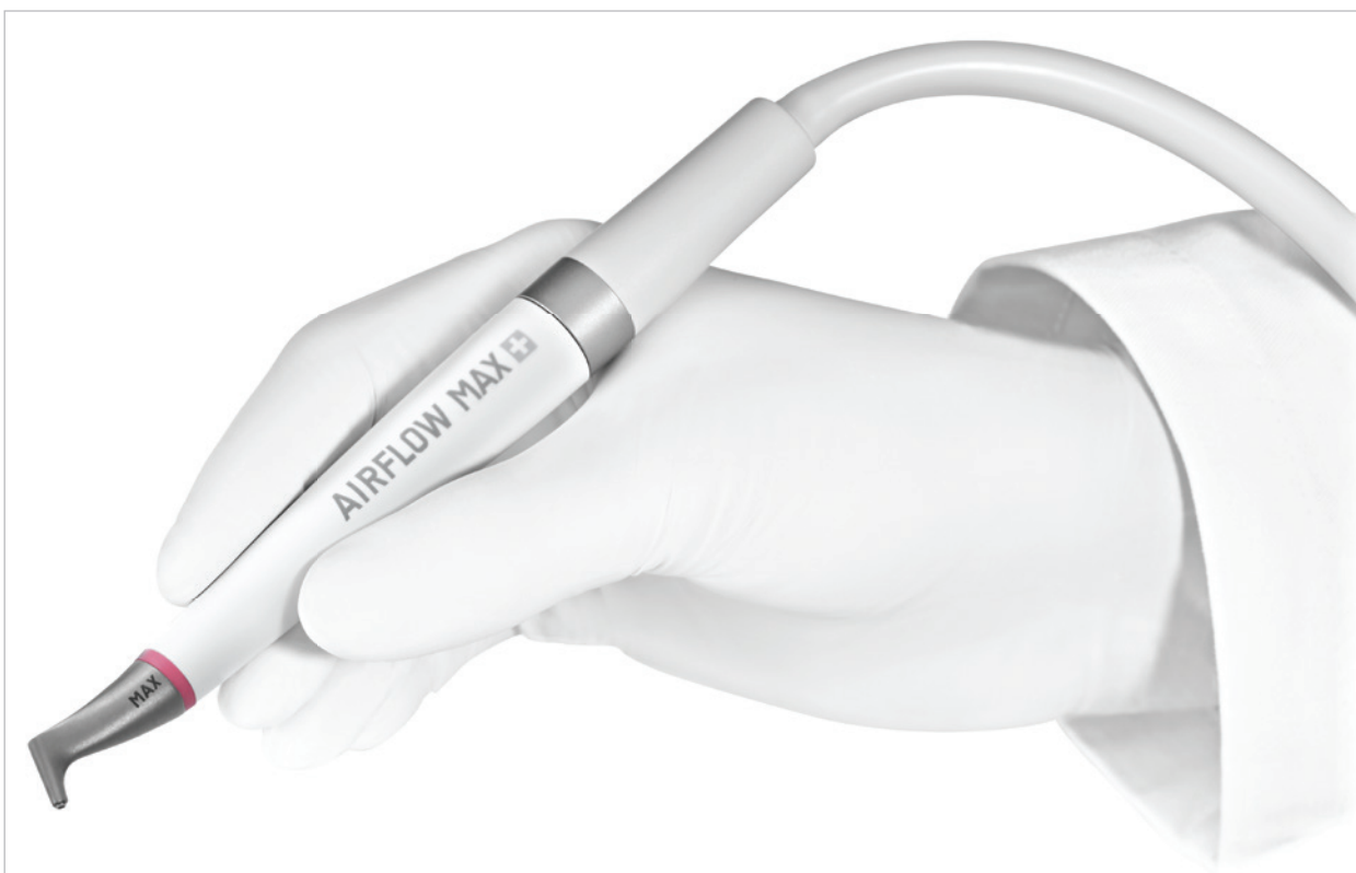
•AIRFLOW MAX ist die neueste Entwicklung von EMS. Das Handstück verfügt über die patentierte GUIDED LAMINAR AIRFLOW Technology. •AIRFLOW MAX is the latest development by EMS. The handpiece features the patented GUIDED LAMINAR AIRFLOW technology.