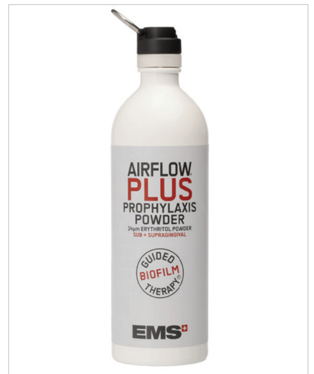
•Das AIRFLOW PLUS Pulver ist neu in einer hochwertigen Aluminiumflasche erhältlich. Diese kann nach Verbrauch als Trinkflasche genutzt werden. •AIRFLOW PLUS powder is now available in a high-quality aluminium bottle, which can be reused for beverages.